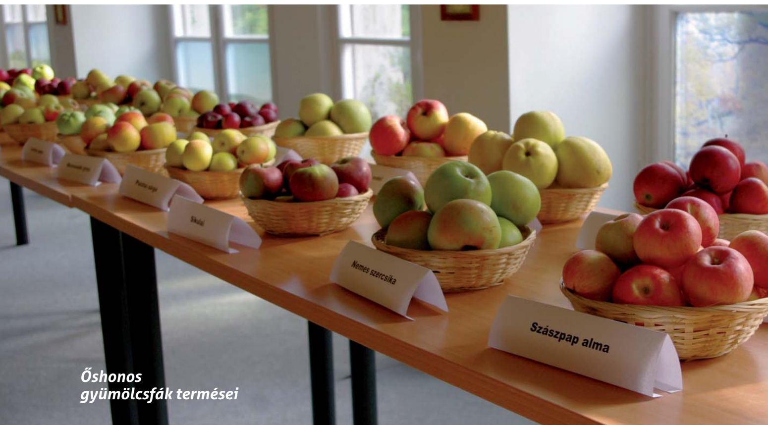
Őshonos gyümölcsfák termései