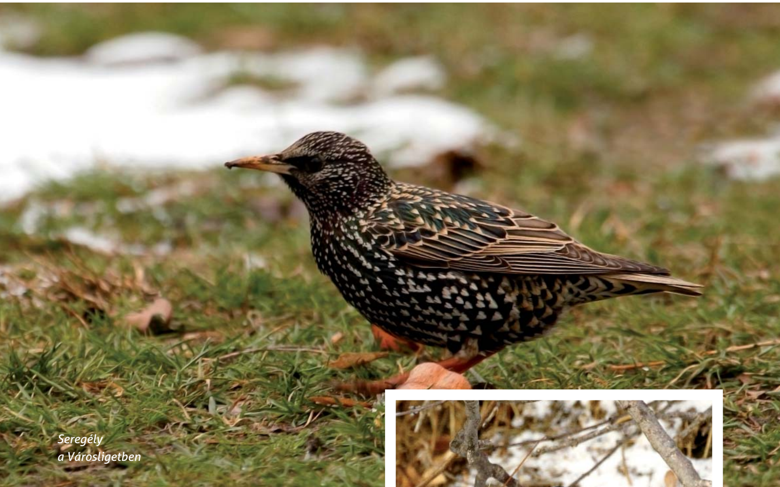
Seregély a Városligetben

köles vagy a pintyeknek és papagájoknak árult keverékek. Emellett továbbra is adhatunk almát a madaraknak. Legkésőbb április első felében azonban abba kell hagyni az énekesmadarak etetését, a költési időszakban más-hogy (az itatás folytatásával, odúk és szőr fészekanyag kihelyezésével, porfürdővel stb.) segíthetjük a körülöttünk élő szárnyasokat. Ha nem így teszünk, a szükségtelen nyári etetés infantilizálná az egyedeket, elkényelmesítené a szülőket, a természetestől eltérő táplálékviszonyokhoz szoktatná a felnövekvő generációkat, a mesterséges táplálékhiány pedig folyamatos emberi beavatkozás nélkül életképtelen szintre növelhetné a fészkelőállományt. Fontos tudni, hogy a vízimadarakat soha semmivel nem szabad etetni, mert náluk az ilyen jellegű emberi beavatkozás súlyos viselkedésváltozást okoz, ami télen a madarak pusztulását okozhatja!