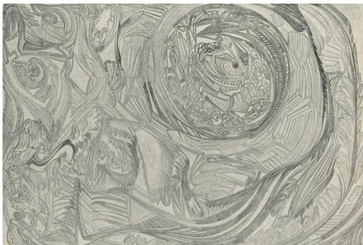
Illusztráció Lyka Károly: „Médium-rajzok” című cikkéből, In: Művészet , 1909, 8. évf., 4. szám, 249-252.

művészekről a századelőn, vagy már ekkor felvetődik az ötvenes évek art brut kategóriája? A teozófusok számára a személy és az alkotói folyamat egymástól különválasztható, akárcsak egy automata esetében, ennek köszönhetően sok laikus, nem művész értelmiségi is elkezdett kísérletezni különféle automatikus technikákkal. A szellemtani irányzatok a képzőművészetben, akárcsak a már említett Kandinszkij, Mondrian esetében is, sok esetben a szimbolikus, vagy az absztrakt művészet irányába hatottak. A magyar festők esetében a teozófia elsősorban nem a stílus, hanem a téma szintjén mutatkozik meg: alkalmanként tipikusan buddhista témákat, teozófus jelképeket alkalmaztak, s műveik témája is gyakran utalt valamelyik szent tanításra vagy szimbólumra.