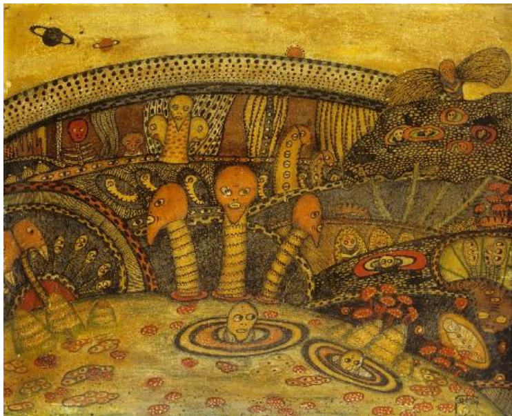
Mokry-Mészáros Dezső: Élet idegen Planétán I. 1910, Magyar Nemzeti Galéria, karton, olaj, 26x32 cm, ltsz: 66.6 T

Nézzünk erre egy példát: Mokry-Mészáros Dezső 10 életművének monografikus feldolgozási kísérlete a művészettörténeti kánon kereteinek szűkösségére mutat rá. Bár a művészi oeuvre értékeit a szűkebb szakma és a gyűjtői kör, a műkereskedelem is elismeri, Mokry-Mészáros műveinek nagy részét a Kecskeméti Naiv Művészetek Múzeuma, mint naiv műalkotást őrzi. Köszönhető ez annak, hogy alkotásaiban, akárcsak a fentebb leírt jelenségekben megmutatkozó anomália, nem csak a téma és formakészlet szintjéig, hanem a dolgok valódi természetéig hatol. A tudományos igényvel megírt spirituális szövegekkel szemben a teozófus művész képein épp ellentétes irányú mozgást figyelhetünk meg: a művészi, ösztönös világba behatoló tudományosság egyfajta homályos („naivnak tűnő”) lebegtetést idéz elő, mely megóvja a műveket attól, hogy a