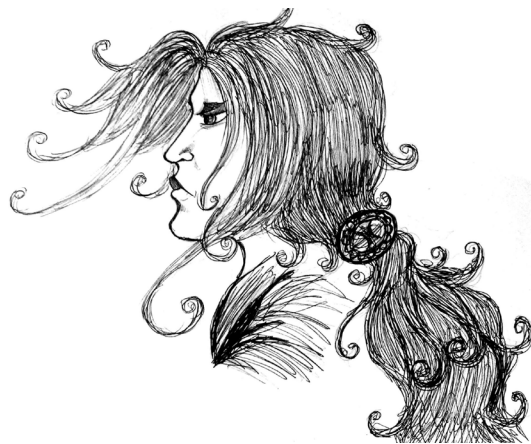
Kép: Tóth-Palásthy Luca (Laerthel)

Megoldás: 1. Fëanáro – (f) Amras; 2. Maírimo – (d) Caranthir; 3. Tyelkormo – (e) Amrod; 4. Makalaurë – (h) Maglor; 5. Atarinke – (g) Curufin; 6. Ambarussa – (f) Amras; 7. Carnistir – (d) Caranthir; 8. Ambaro – (e) Amrod.