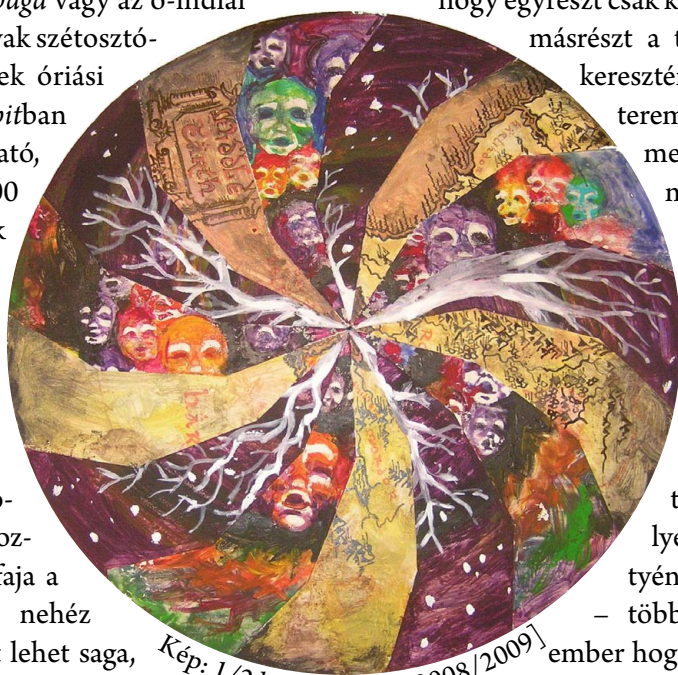
Kép: 1/2 hobbit [TLV 2008/2009]

1) teremtés megformálás vagy munka által; 2) teremtés (nemzés és) szülés által; 3) teremtés harc által; 4) teremtés ige által. Az első kategóriát megtaláljuk a Biblia elején az 1Móz 2-ben. A negyedik is erősen