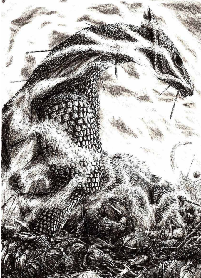
Kép: Joona Kujanen [DeviantArt: Tulikoura]

földművelést, amennyire lehetett, kerülték, és az élelmiszert inkább csere útján szerezték meg. Jó barátságot mindössze a tündék közül kirekesztett Eollal kötöttek, ám őt tanították, és az ünnepeiken gyakran vendégül is látták. Összességében jó viszonyuk alapja a tündékkal nem a szimpátia, hanem a közös ellenség tudata és jelenléte volt.