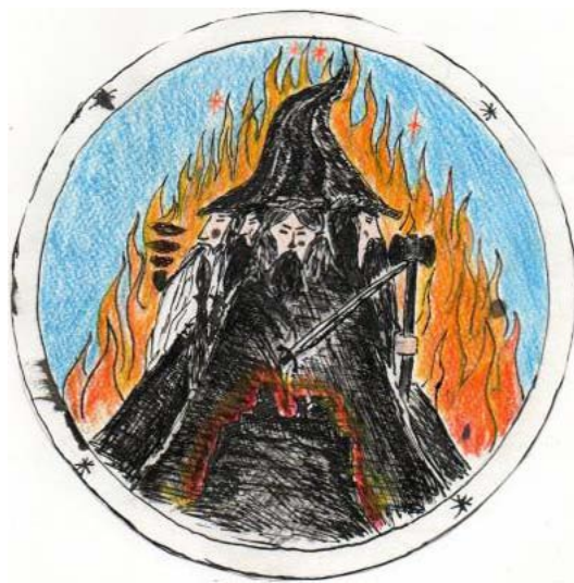
Rajz: Dolgulduri betyárok (TLV)

Az is közrejátszhat a dologban, hogy Tolkien maga határozott elveket vallott, és nem hiszem, hogy az árnyalt, valóságghú karakterekre akarta helyezni a hangsúlyt – leveleiben sokszor kifejti, hogy munkáinak legfőbb célja a morális üzenet közvetítése.