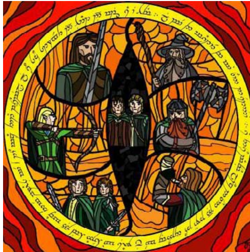
Rajz: Annatar Kisiparos Egyesület (TLV)

Megfejtés: a - 3; b - 7; c - 5; d - 2; e - 6; f - 1; g - 4