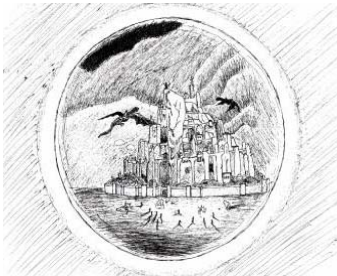
Rajz: Caledhril (TLV)

Érdekes megjelenése a rohani rítusnak a ló eltemetése: Théoden lovának, Hósörénynek a sírját az emberekéhez hasonlóan földkupaccal és egy feliratos kőoszloppal jelölték meg („ de Hósörénynek sírt ástak, fejéhez követ állítottak, s rávésték Gondor és Lovasvég nyelvén: Hű szolgálja s úr-sorsa Lény: / Szélláb csikaja, Hósörény. Hósörény sírján zöld és selymes szálú fű nőtt ”). Ugyancsak érdemes