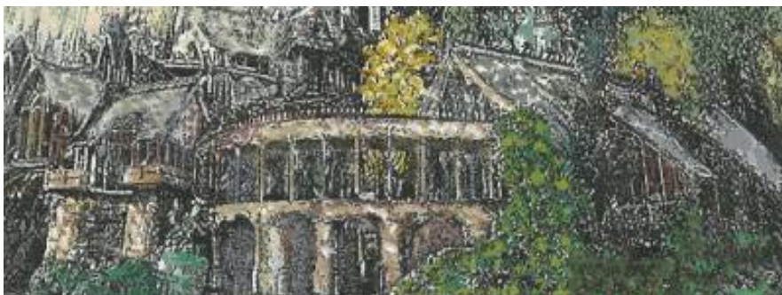
Rajz: Tuilinneth (TLV)