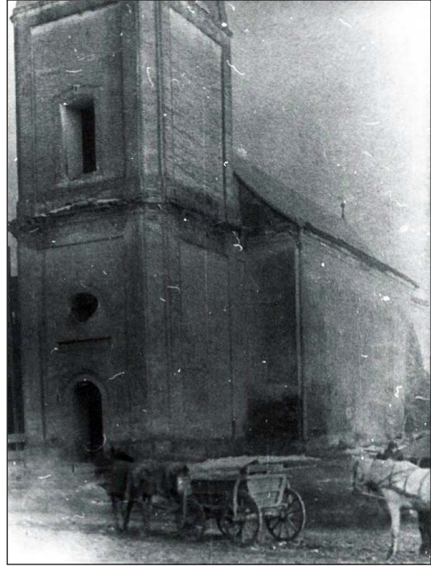
A régi vásárosnaményi református templom

„Die 10a January. N. Ttes Lónyai és V. Naményi Lónyay Ilona Aszsz. Néhai b. e. N. Ttes Vajai Vay István Úr el maradtott Özvegye, minekutánna Januáriusnak 9dik nap-