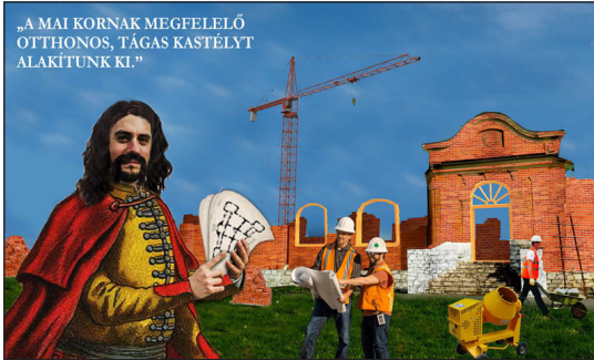
Illusztráció a Beregi BORSÓ ból (Szász Csaba munkája)

vezett épületről csak a XX. század elejétől vannak képeink.