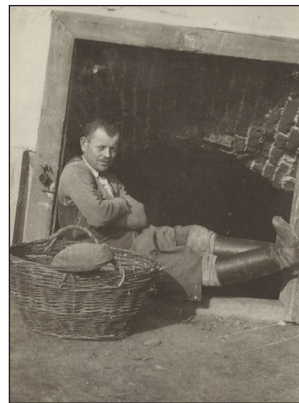
A Tomcsányi család fotója

Korábban említettük, hogy nem dúskálunk képekben a vásárosnaményi Lónyayakról. Ez hatványozottabban igaz az udvarház népére. A XX. századból viszont vannak már olyan fotóink, ahol feltűnnek tanyagazdák, kondások, béresek, gulyások stb. Az egykori kopócsapáti földbirtokos Ujhelyi Tivadarnak a Beregi Múzeum tulajdonában lévő fotóalbumaiban is találunk képeket lovászokról, kocsisokról, aratókról. (Bár azt is hozzá kell tennünk, legtöbbször nem ők a főszereplők, annál inkább a mellettük-előttük látható pompás kanca vagy szarvasmarha...)