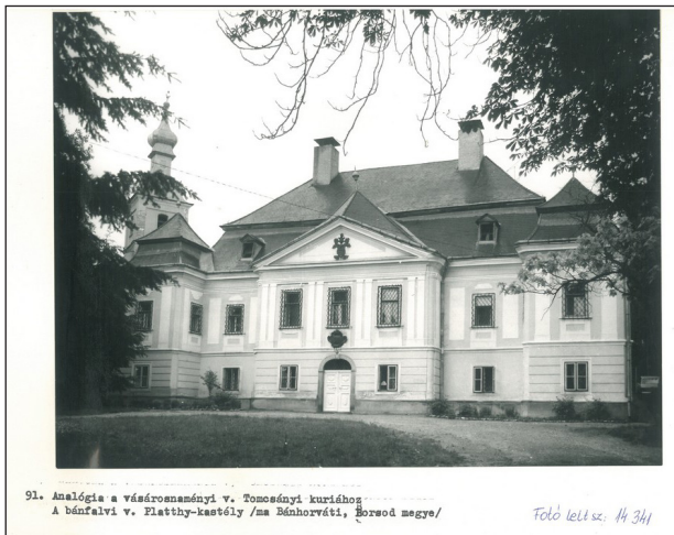
A bánhorvát Platthy-kastély