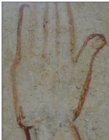
7. kép – Krisztus jobbjá

Ugyanakkor a mesterek biblikus műveltsége sem volt kifogástalan, a latin szövegek tartalma összemosódhatott bennük, olykor elrugaszkodhattak azoktól. Például Márokpapiban a keresztre feszített Jézus 24 – angyali kísérettel – ám a kereszttel együtt száll fel a mennybe (8. kép), holott a keresztény ember számára köztudott volt, hogy az kereszt „ezen a világon” maradt. Azt találta meg Szent Ilona, akit számos freskón lát-