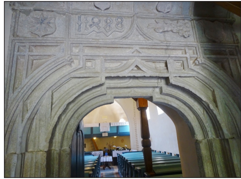
2. kép – A későgótikus kapuzat

léletes leírása szerint: „A kapu alja sarokgúlás kiképzésű. Fölötte sajátos oszlopszékekből indulnak ki a mély hornyokkal elválasztott pálcátagos, melyek a vállnál megkettőződnek. Az egyik része a szemöldökgyámos íves formát követve egymással többszörösen metsződik. Az egyenesen futó tagozatok gyémántmetszésű csomópontokat alkotnak. Az íves tagozatok a kapunyílás közép része felett számárhátívben találkoznak. A kaput legfelül többször tagolt szemöldök zárja le, melynek mezőiben egy-egy címerpajzs, kézfej és az 1488-as felirat látható” (2. kép).