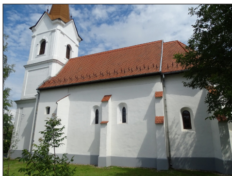
1. kép – Nyírtura református temploma

A XIV-től a XIX. század közepéig a Kállay család birtoka. 5 Kúriájuk a XIX.