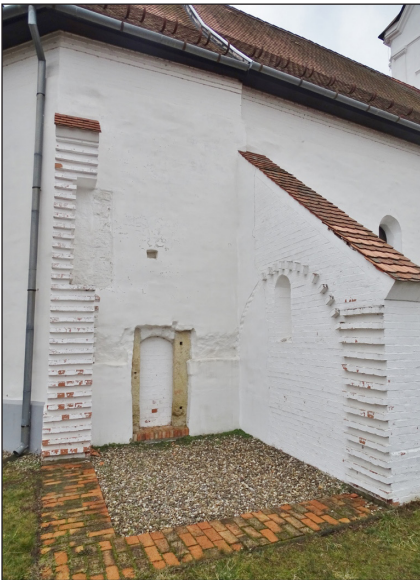
3. kép – A sekrestye maradványa