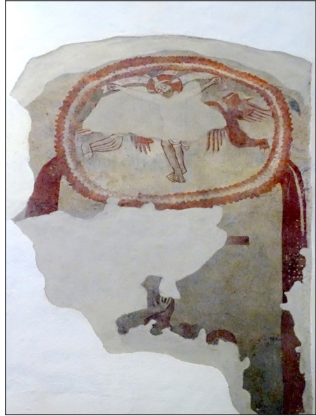
8. kép – Freskórészlet Márokpapiból