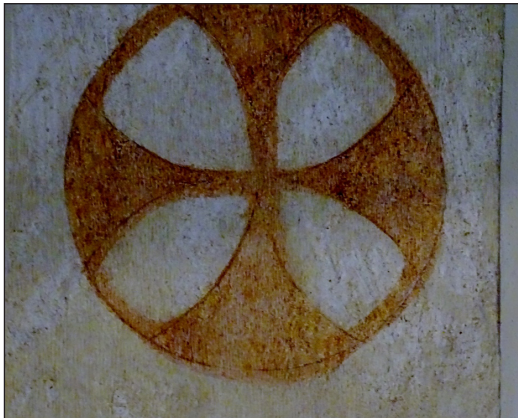
5. kép – Felszentelési kereszt

A nyírturai Krisztus-ábrázolást megőrző templom építését csak ezen kutatás óta teszik a XIII. század második felére.