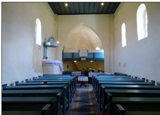
4. kép – A templombelső a szószékkel és a diadalívvel

A szerző saját elnevezése szerint „a ruháitól megfosztott áldó Krisztus” falképet 12 vékony vakolatrétegre és többretegű meszelésre készítették, melyen a vörös színű előrajz jó állapotban maradt meg, de – mint a templom egyik kutatója véli – a festés mára már elpusztult 13 (6. kép).