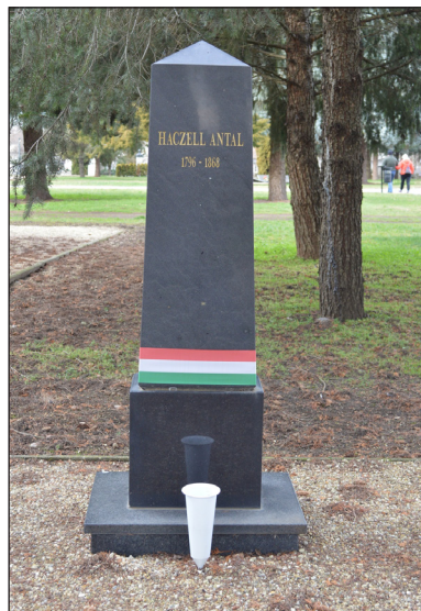
9. kép – Haczell Antal sírja