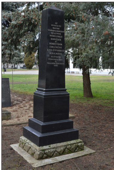
3. kép – Az 1848-as sírkert emlékoszlopa