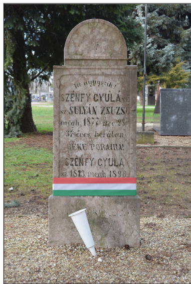
2. kép – Szénfy Gyula sírja