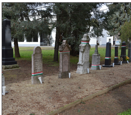
1. kép – Az 1848-as sírkert