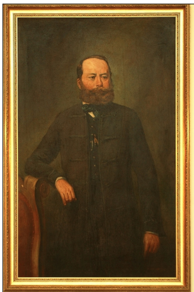
16. kép – Krasznay Gábor

sekor Nagykállóban megyei főügyészként állt a vármegye szolgálatába. Két öccsével, Krasznay Ádámmal (1823–1894) és Krasznay Péterrel (1830–1916) együtt küzdött a szabadságharcban. 1848. augusztus 12-én, hadnagyként tagja lett a Szabolcs vármegye által alakított önkéntes mozgó nemzetőr zászlóaljnak. Ugyanebben az alakulatban 1848. szeptember 12-én főhadnaggyá léptették elő, s Görgei Artúr őrnagy, majd Perczel Mór tábornok alárendeltségében részt vett a Josip Jelačić elleni harcokban. Krasznay 1848. november 10-től honvéd főhadnagy a 48. honvédzászlóaljja vált alakulatánál. Perczel tábornok Központi Mozgó Seregének – illetve az ebből létrejött II. hadtestnek – a kötelékében, Aulich Lajos tábornok vezetése alatt a főhadszíntéren küzdötte végig a téli és a tavaszi hadjáratot. 1849. június 1-jén századossá