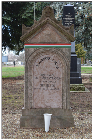
4. kép – A Kralovánszky család sírja