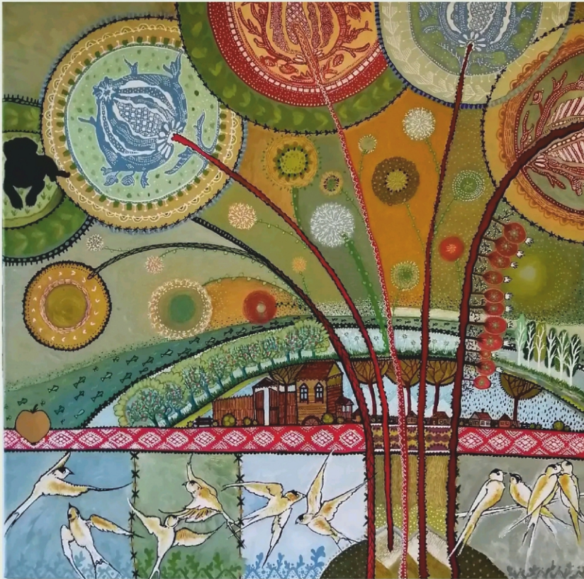
HAVASI DÓRA: „TÁLPUNK ALATT FÜTYÜL A SZÉL” II. (2019)