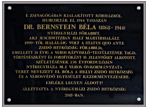
Bernstein Béla mártírhalált halt nyíregyházi főrabbi 2018-ban avatott emléktáblája a zsinagóga falán.