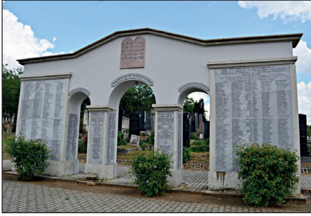
Zsidó elhurcoltak emlékműve a nyíregyházi Kótaji úti izraelita temetőben.