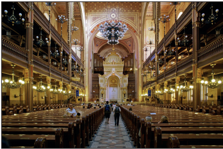
Budapest, Dohány utcai zsinagóga. Épült 1854-től, megnyílt 1859-ben.