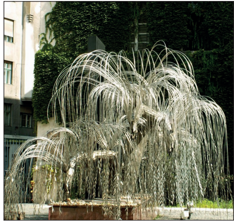
Az Emlékezés Fája