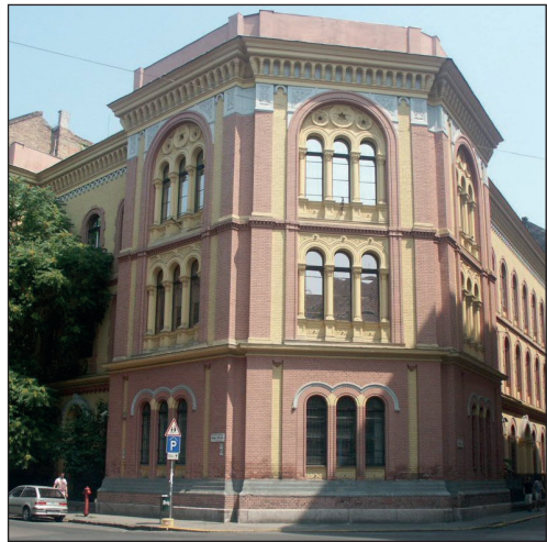
A Rabbiképző alapításkori épülete ma