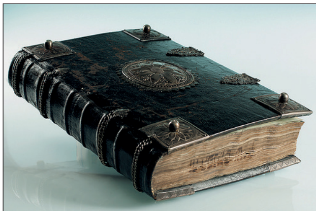
Hevra Kadisa. 1792-ben kezdték írni.