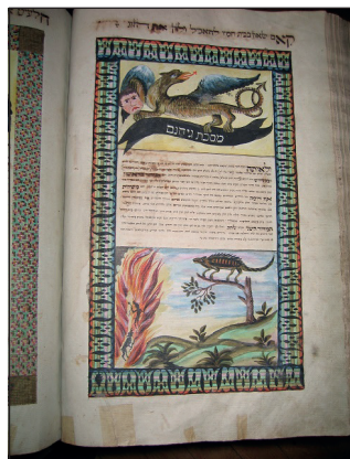
Egy belső oldal.