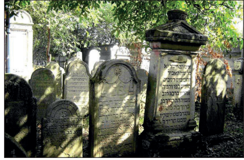
Sírkövek a csengeri zsidó temetőben. A legrégebbi 1755-ből való.