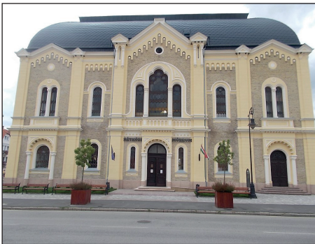
Kisvárd, az 1901-ben épült ortodox zsinagóga. 1983-tól múzeum.