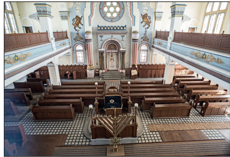
A nyíregyházi zsinagóga – ma.