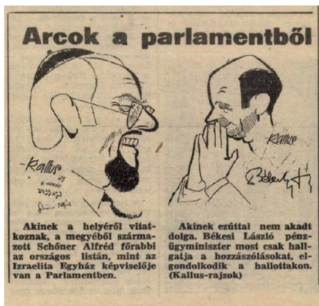
Kelet-Magyarország, 1989. október 20.