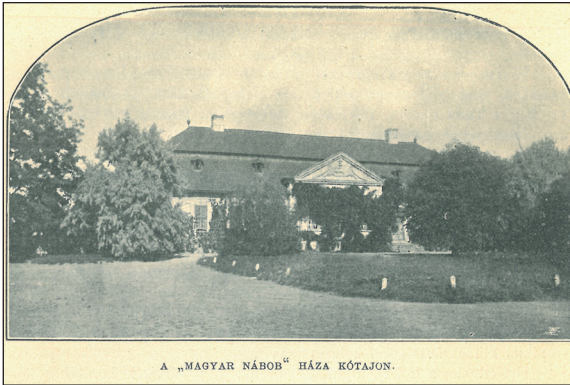
A „MAGYAR NÁBOB” HÁZA KÓTAJON.