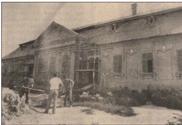
A kastély felújítása 1990-ben

kívánta a helyreállítási munkálatokat fedezni, melynek keretében elsőként a szükséges állagmegóvást végezték volna el az épületen, majd a belsők helyreállítását követően külön tanulmánytervet készítettek volna a kúria korhű berendezésére. 57 Ez azonban sokáig csak terv maradt, hiszen majdnem egy évtized telt el, mire 1985 őszén ténylegesen megkezdődtek a renoválási munkálatok. Először kicserélték a födémeket, felszedték a padlót és előkészítették az épületet az aprólékos helyreállítási munkákhoz. 1986-ban a tetőszerkezet felújításával és a falfestések rendbehozatalával folytatták a munkálatokat, 58 majd 1987-ben újabb kétmillió forinttal támogatták a projektet és tervbe vették, hogy a Szabolcs-Szatmár-Bereg Megyei Múzeumok Igazgatósága ipartörténeti, illetve helytörténeti kiállítási anyagait az épületben helyezik majd el. 59 1990-re hat helyiség padlózatát sikerült pótolni, fehérre meszelték a falakat, de a nem mindennapi látványt nyújtó díszterem is visszanyerte a régi fényét, melynek mennyezetén a műzsák, az összhang, a harmónia és a ritmus istennői