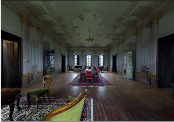
A kastély nagyterme napjainkban