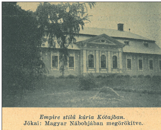
Empire stílusú kúria Kótajban. Jókai: Magyar Nábobjában megörökítve.