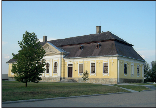
A kastély 2018-ban

Az épület belsejében a teljes mélységben végighúzódó díszterem két oldalán két-két sor szoba található. A főhomlokzati oldalon két bejárati előcsarnok, egy nagy és egy kis szoba van – ezt a részt később átalakították. A nagyszalon mennyezetére festett grisaille modorú freskók a kilenc műsát ábrázolják. Az oldalfalakat architektonikus festés díszíti, míg a főhomlokzati fal ablakai között