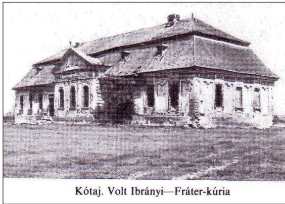
Kótaj. Volt Ibrányi—Fráter-kúria

a kisgazdapárt megalapításában is sokat fáradozott. Szóval, hogy megéljünk, dolgozni mentem Pestre. Egy bölcsődébe kerültek, egy fizetésből egyedül neveltem fel az itt maradt két gyereket. A kastélyt az oroszok csaknem elkótyavetyélték. Kinyitották az ajtókat és hagyták, hogy az emberek széthordjanak mindent. Nem is maradt semmi csak ez az egy kép a falon, még az esküvőnkre készítette az édesapám Ijjász Gyula (1874–1943) festőművésszel. Most olyan antik berendezések állnak itt, amik abszolút kiríznak a környezetből. Az eredeti tárgyakból Vencsellőre és Nagyhálszba is került egy-egy darab. Névtelen levelekben meg is írták, hogy néhány dolgot hol találhatok meg, de nem mertem utánajárni, mert féltem, meg is ölhetnek miattuk, s akkor mi lesz a gyerekekkel. Emlékszem, volt egy gyönyörű szekreter a nagyszobában, amit még nászajándékkul kaptam, ki lehetett nyitni íróasztalnak, s egy titkos leveles fiókot is rejtett magában. Azon állt egy csodálatos rézóra két réz gyertyatartóval. A falakat fehérre meszelték, de olyan értékes képek vannak alatta, hogy nincs is több ilyen az országban. A nagyszobai legalábbis ilyen, a múzsákat ábrázolja görög istennők koszorújában, a szabolcsi műemlékesek nem tudták rendbe hozni. Sokáig raktárnak, magtárnak meg mindenfélenek használták az épületet. Az 1950-es évekre tönkre is ment, 1962-ben aztán jött egy miniszter, megnézte, gyönyörűnek találta és intézkedett a rendbehozataláról. A műemlékesek kb. 5 évig dolgoztak rajta. (...) Kítették rá a mű-