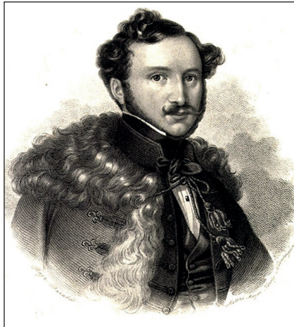
Jósika Miklós (1794–1865)