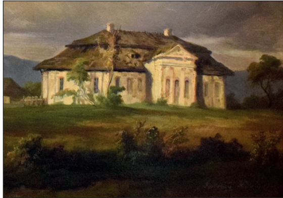
Jakobey Károly: Kazinczy Ferenc háza, 1859