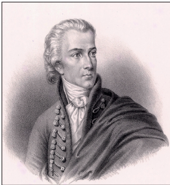
Kazinczy Ferenc (1759–1831)

1800-ban Ibrányi Károlyné Krajnik Mária testvéreinek sógora, Kazinczy Ferenc (1759–1831) író, a magyar nyelvújítás vezéralakja is megfordult Kótajban, aki szintén nem a ma látható kúriában, hanem az 1815-ben lebontott házban szállt meg. Kazinczyt ekkor kufsteini börtönéből jókora kerülőkkel Munkácsra szállították: 1800. június 30-án indultak el, s augusztus 12-én Rakamaznál értek Szabolcs vármegyébe. 7 Kazinczy a Fogságom naplója című önéletrajzi jellegű művében így emlékezik vissza: „Tokajból tehát augusztus 12-én indulánk. (...) Délben már Kótajban valánk. Ibrányi Károlyné asszony kérette, szálljunk oda, de Szulyovszky (Menyhért) nem