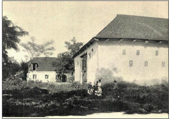
A Török-szakad csárda 1900-ban