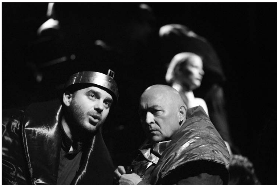
Shakespeare: Hamlet (1997) Rendező: Verebes István • Kerekes László, Szigeti András