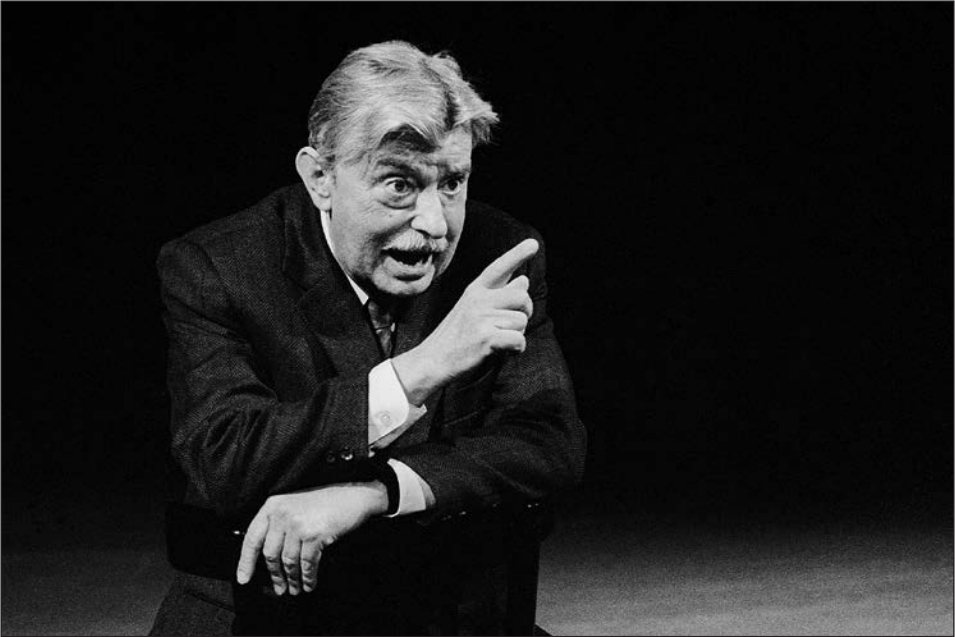
Thornton Wilder: A mi kis városunk (1989) Rendező: Mensáros László