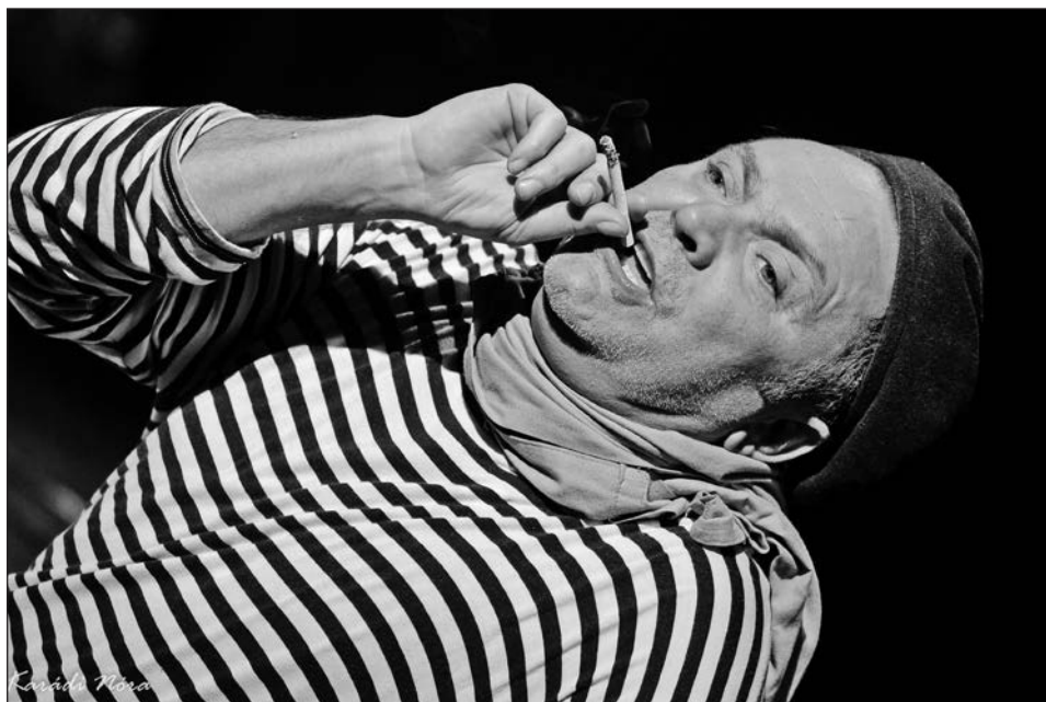
Bohumil Hrabal: Túl zajos magány (2016) Rendező: Ivo Krobot • Horváth László Attila