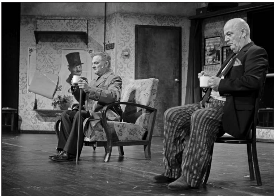
Neil Simon: Napsugár fiúk (1990)