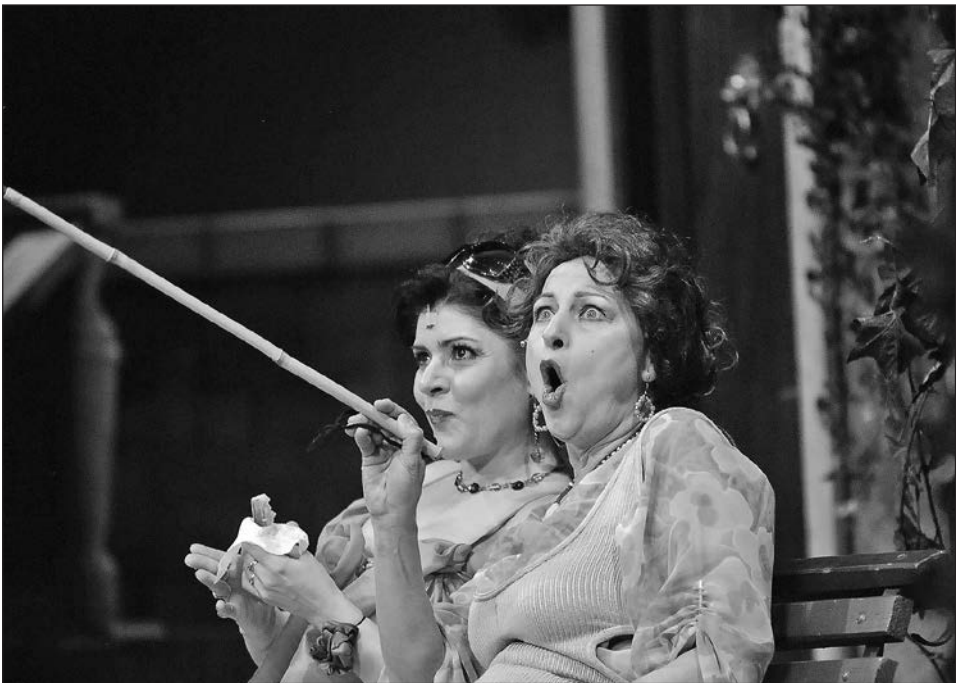
Vajda Katalin-Fábrí Péter: Anconai szerelmesek (2000) Rendező: Tarsnádi Csaba • Gosztola Adél, Varjú Olga