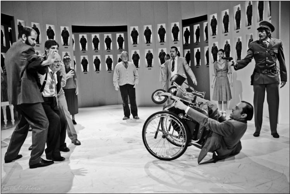
Egressy Zoltán: Idősutazás (2016) Rendező: Szócs Artur