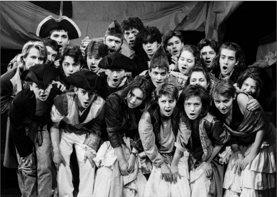
Büchner: Danton (1990) Rendező: Gaál Erzsébet