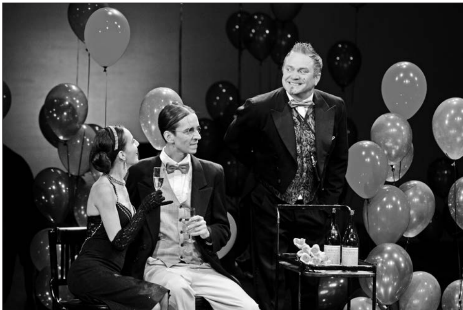
Szép Ernő: Lila ákác (2012)