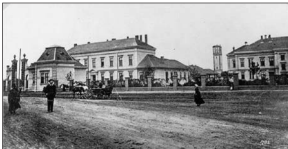
4. kép – Nyíregyházi kórház

Nagy különbség lehetett a fővárosi modern, jól felszerelt klinika és a kállói kis kóróda állapota között. Kállay azonban nem hátrált meg, sőt bizonyára kihívást jelentett a fiatal ember számára, hogy Jósa példáját követve, szakmai tudással felvértezve jobbítani tud szülőmegyéje akkor még nem túl rózsás közegészségügyi helyzetén.