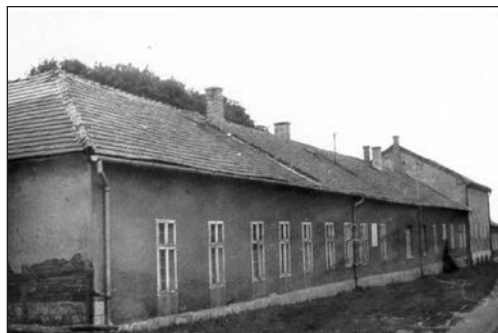
3. kép – Nagyállói kórház