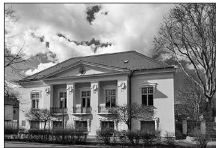
6. kép – A Kállay ház