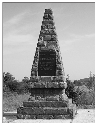
14. Salánk – Mikes kútja (1991)