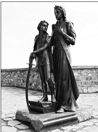
6. Munkács – Zrínyi Ilona és a kis Rákóczi Ferenc (Matl Péter, 2006)

leírtak alapján érthető, hogy a várban Zrínyi Ilonának és fiának több emlékhelye megtalálható. A hős vándor asszony előtt tisztelegve a sárospataki Rákóczi Múzeum, a munkácsi II. Rákóczi Ferenc Irodalmi és Művelődési Kör 1993-ban a belső udvaron domborműves emléktáblát (5.) állított fel. A sárospataki múzeum kezdeményezésére, a vár egyik helyiségében Rákóczi-emlékszobát alakítottak ki 1999-ben. A felső várban 2006-ban anyát és fiát közös szoborcsoportban (6.) örökítették meg.