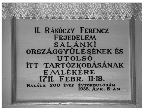
13. Salánk – A salánki országgyűlés emléktáblája (1935)

A korábbi kutatások megállapították: a kulturális természetű identitásképzés fontos elemeként a kisebbségi magyar közösségekben a vallás szerepe felértékelődik az egyéni, valamint a csoportidentitás megőrzésében. 26 Az általunk megkérdezett kulturális szakemberek közül mindenki kiemelte a vallás közösségalkotó erejét. A „Van-e szerepe a vallásnak a nemzeti identitás megőrzésében?” kérdésre jellemző válasz: „Igen van! Kisgyermekéknél az esti imák és mesék anyanyelven történő hallgatása, illetve az istentisztelet, szent liturgia, mise anyanyelven való celebrálása nagyon fontos az identitás megőrzésében. Nálunk falun, aki református, az magyar nemzetiségű, illetve még vannak magyar görögkatolikusok. Ha ortodox vallású valaki a családban, előbb vagy utóbb az ukrán iskolába íratják a gyereket és lassan elfelejtik a magyar anyanyelvüket.” (42 éves, Salánk)