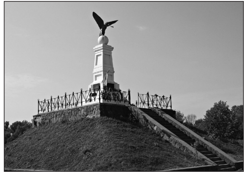
1. Tiszaújlak – Turulmadaras emlékmű – (1903, 1989)

A kedvezőtlen politikai feltételek ellenére Trianon után sem szakadt meg az emlékezés. Az 1935-ös év különösen jelentős jubileum: napra pontosan április 8-án volt a fejedelem halálának 200. évfordulója. Magyarországon és az elcsatolt területeken is megemlékeztek a fejedelemről, a szabadságharcról. A Csehszlovákiához tartozó Felvidéken Kassa, Pozsony, Komárom kulturális egyesületei szervezték az ünnepségeket, míg Kárpátalján a Szlovenszkoí Magyar