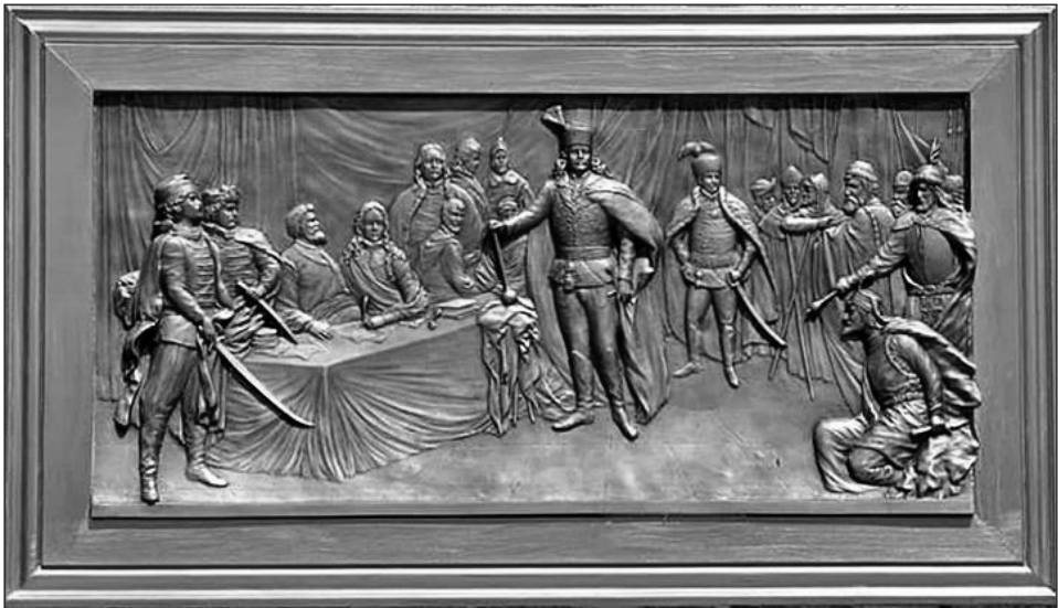
Salánk - Mihail Iscsenko: A salánki országgyűlés emlékére (2019)

A Kárpátalján fennmaradt történeti hagyomány azt mutatja, hogy ezen a területen a nép történetében különösen jelentős, a folklórban is mély nyomot hagyó idő volt a kuruc-kor, a Rákóczi-szabadságharc, s II. Rákóczi Ferenc, akinek alakja köré mítosz teremtődött és személye történelemfelettivé vált. Itt áll Munkács vára, ahol a hős Zrínyi Ilona védte gyermekeit és a hazát, innen indult el az ország függetlenségének megteremtésére Bercsényi Miklós vagy itt szállt a legmagasabbra Rákóczi turulmadara, amely jelképe lett a magyar közösség szabadságvágyának. A néphagyományok, a harcokban mutatott hősiesség magatartás a nemzeti mitológia szerves része. 29 Rákóczi kultusza tudatformáló erőt képvisel, amely a társadalom egészének nemzeti identitását határozza meg mindenütt, ahol magyarok élnek. A kárpátaljai magyar közösség történetében és tudatában úgy él II. Rákóczi Ferenc, mint ahogy Emlékiratok című művében megfogalmazta: „Minden cselekedetem célja egyedül a szabadság szeretete volt, az a vágy, hogy hazámat az idegen járom alól felszabadítsam. Bátorított és erősített az a szándék, hogy megérdemeljem a nép bizalmát és szeretetét.” 30