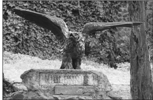
2. Ungvár – A tiszaujlaki emlékmű lebontott turulmadara az ungvári vár udvarán

számban találkozunk ilyen, a kultusz ápolását szolgáló kulturális értékekkel. A sort kezdjük Ungvár várával, ahol Rákóczi-emlékkiállításal (ez a Kárpátaljai Megyei Honismereti Múzeum állandó tárlata) tisztelgnek a fejedelem emléke előtt. Az 1903-ban felállított tiszaujlaki emlékmű 1945-ben eltávolított turulmadara (2.) a várudvaron nyert elhelyezést, talapzatán a Millennium felirat olvasható. Ung vármegye egykori főispánja, a vár ura, a szabadságharc második embere, Bercsényi Miklós szintén megkülönböztetett figyelemben részesül a városban. Az erősségben került felállításra a mellszobra (3.), annak közelében a második feleségét, Csáky Krisztinát (4.) megőrkítő műalkotás. A városban szintén találhatóak olyan művészeti alkotások (emléktábla, szobor), amelyek az előbb említett három személyt örökítik meg.