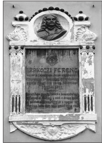
7. Munkács – II. Rákóczi Ferenc dom-borműves emléktábla (1911, 1989: a felújított relief Matl Péter alkotása)

A szabadságharc nevezetes helye még Salánk, ahol szintén több emlék utal az akkori eseményekre. Itt is volt kastélya a Rákóczi családnak (mára elpusztult), itt tartották 1711 februárjában az utolsó kuruc országgyűlést. A monda szerint igen furcsa helyszínen, a Hömlőc-hegy tetején lévő erdőben találkoztak a résztvevők. A ma is látható asztalnak használt hatalmas kővön íródtak