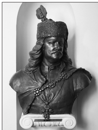
10. Beregszász – II. Rákóczi Ferenc (Tamáska János, 2008)

A magyar közösség a XIX. században alakította ki a nemzeti fejlődéshez szükséges gazdasági, társadalmi, politikai és kulturális eszközrendszerét, ezek segítségével teremtette meg a nemzet tudatát. A magyar nemzettudat a kultúrnemzeti koncepció köré szerveződött, mely a nemzeti nyelv, a történeti hagyományok és a kultúra eszközével tudta hatékonyan leírni a Kárpát-medence magyarságának jellemzőit. Bár a magyar nemzettudat kiváló kutatójánál, Szűcs Jenőnél megjelent a magyar nacionalizmus és nemzeti tudat kettős jellege (kultúrnemzet, államnemzet), de már Bibó István is leírta azt, hogy az államnemzeti koncepció érvényesülése problematikus volt az állam többnyelvűsége és az egyes országrészek több évszázados eltérő fejlődése miatt. 22 Az I. világháborút követő hatalomváltások,