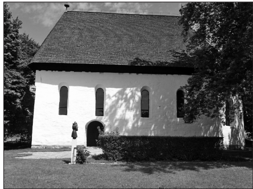
Szabolcs ősi temploma

„Aki pogány szokás szerint kutak mellett áldoznak, vagy fákhoz, forrásokhoz és kövekhez ajándékokat visznek, bűnükért egy ökörrel fizessenek.” 25