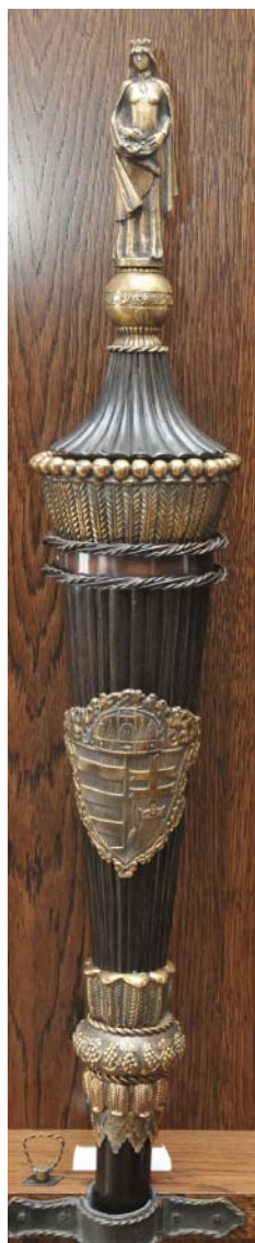
A DE Egészségügyi Karának gerundiuma, Nagy Lajos Imre szobrászművész alkotása (2010)