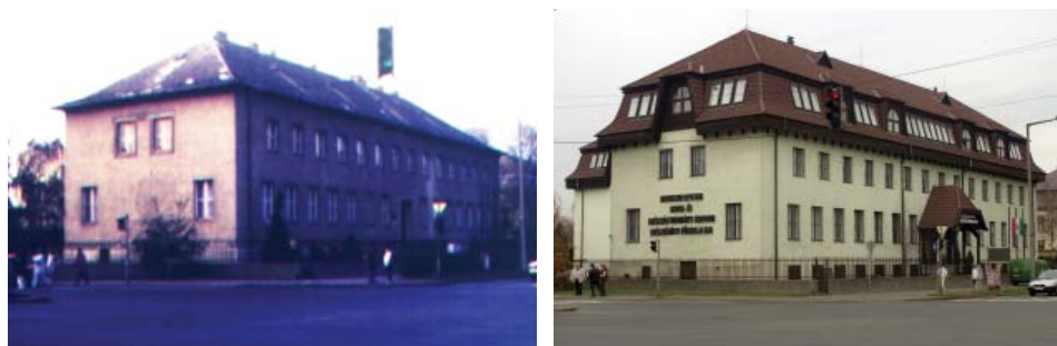
A kar Sóstói úti főépülete 1990-ben és felújítása után, napjainkban

Valószínűleg ma már kevesen tudják, hogy az eredeti tervek szerint ezt az épületet a Bessenyei György Tanárképző Főiskola kapta volna meg, hiszen Örökösföldön, a mai Zay Anna Gimnázium és Egészségügyi Szakközépiskola mögötti üres területen éppen az egészségügyi főiskola számára készült el egy oktatási épület, azzal a céllal, hogy a későbbiekben integráltan működjenek a középfokú és a felsőfokú egészségügyi képzések. Az épület végül is más funkciót kapott, az akkori (ma már talán irigylésre méltó) demográfiai helyzetre való tekintettel hosszú ideig általános iskolaként működött, jelenleg pedig a Westsik Vilmos Élelmiszer-ipari Szakközép- és Szakiskolának ad helyet.