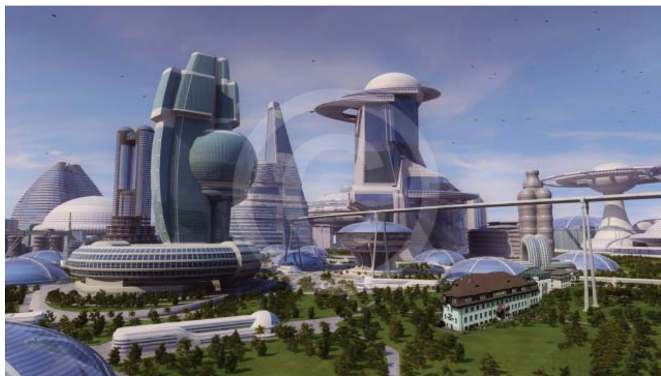
Nyíregyháza a távoli jövőben (nem húsz, hanem 200 év múlva) az Egészségügyi Kar épületegyüttesével

Húsz év természetesen nem igazán hosszú idő egy intézmény életében, hiszen éppen csak kilépett a kamaszkorból, és a felnőtté válás küszöbén áll. Az eddigi tapasztalatok azonban arra utalnak, hogy fiatal felnőttként, a folyamatosan változó körülmények ellenére is egyre biztosabban megáll a saját lábán, ami biztató lehet akár a távoli jövőt érintően is.