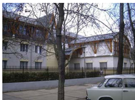
A GYIVI korábbi gyermekotthona az átvételkor, illetve a felújítás után, a tanügyi épületek bővítésekor