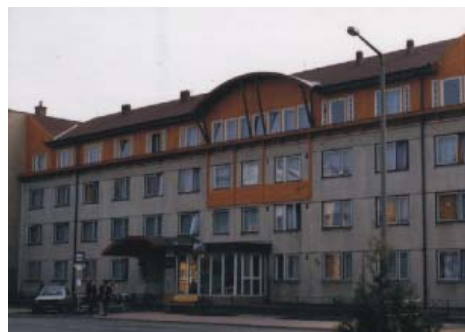
A KEMÉV munkásszállója az átadás előtt és a kollégium jelenlegi formájában

Az évtized során hasonló ütemben folyt a tanügyi épületegyüttes átalakítása és bővítése. Elkészült a Sóstói úti épület rekonstrukciója és tetőtér-beépítése, amellyel megszületett a „főépület” ma ismert arculata, illetve a megyei önkormányzat 1997 év végi döntése alapján a korábbi Gyermekek és Ifjúságvédő Intézet szomszédos épületének átadása is lezajlott. Ez az épület eredetileg bentlakásos gyermekotthon volt, melyet a gyermekvédelem megváltozott jogszabályi feltételrendszere miatt a megye megszüntetett, így az átadás nem zavarta meg az intézmény működését.