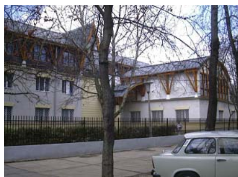
A GYIVI korábbi gyermekotthona az átvételkor, illetve a felújítás után, a tanügyi épületek bővítésekor