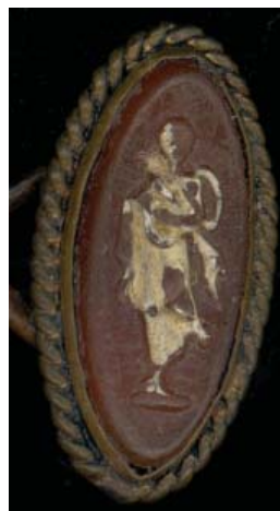
A tisztardosi gemma, 7. kép