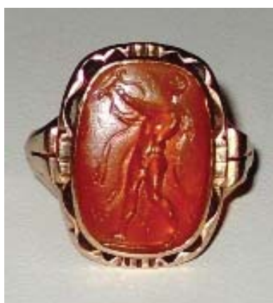
A nyíregyházi gemma, 4/a kép