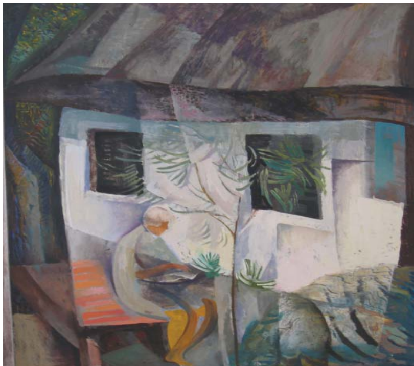
Berecz András: Parasztház leanderrer (1992)