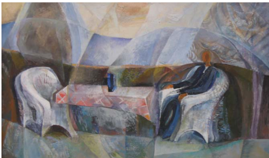
Berecz András: Az egyik szék üres (1999)