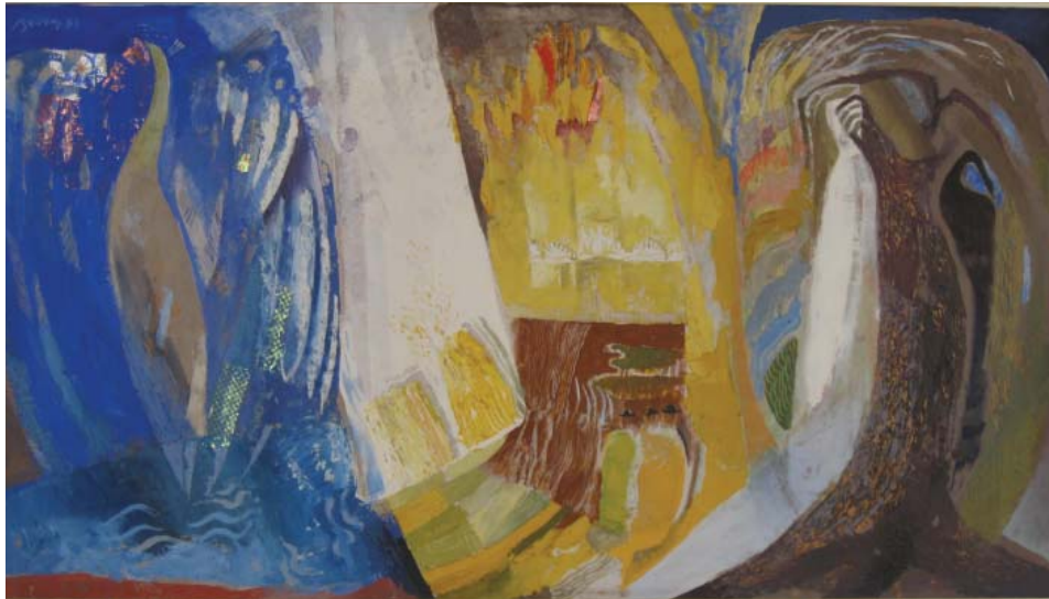
Berecz András: Pávavariációk (1983)