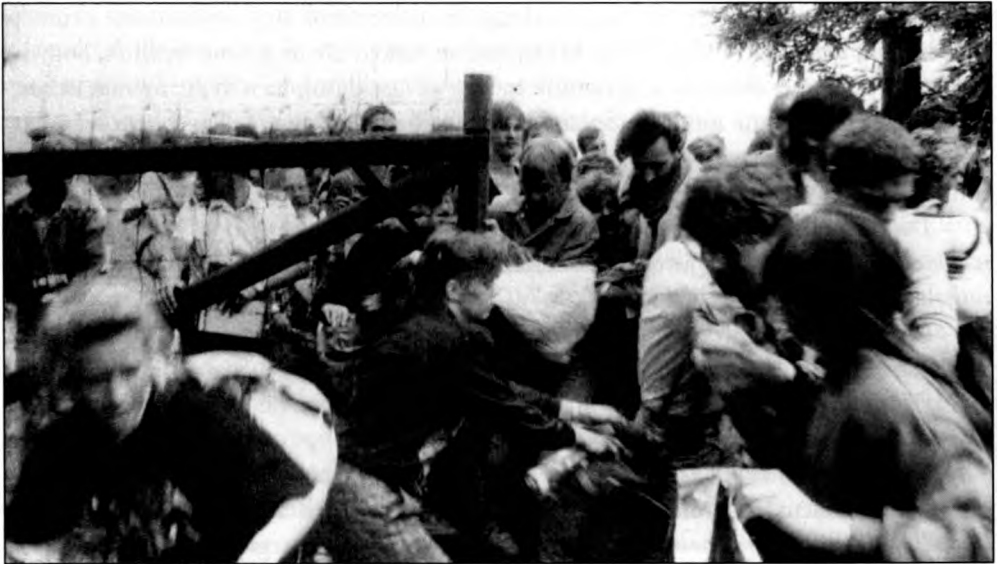
Menekülők a határon, 1989

– Nyolc-tízezer ember gyűlhetett össze, felszabadult volt a hangulat. Jókora késéssel, öt óra tájban kezdődött a meghirdetett politikai program: nyolc nyelven hangzott fel a piknik Mészáros Ferenc által megfogalmazott dekrétuma, neves magyar és külföldi közéleti személyiségek – Lichtenstein herceg osztrák parlamenti képviselő, Klaus Lange, a Páneurópa Unió osztrák elnöke, Konrád György író – szónokoltak, felhangzott Tőkés László temesvári lelkész és természetesen a debreceni és a soproni szervezők üzenete. Osztrák, nyugatnémet, angol, amerikai rádió- és tévétársaságok riporterei rögzítették az eseményeket, interjúkban szólaltatták meg a szónokokat és a résztvevő-