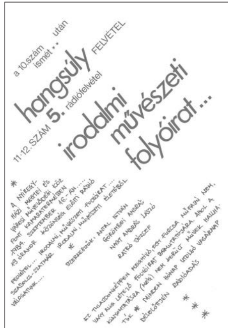
Az 5. rádiófelvétel meghívója

– A 100–120 fős közönség fiatalokból állt, középiskolásokból, főiskolásokból, valamint középkorú értelmiségiekből, művészekből, irodalmárokból. Megszokták ezt a műsorkészítést, és a felvételek jó hangulatúak voltak. Azt lehetett érezni, hogy itt tényleg „történik” valami. Volt olyan felvétel, ami után, hogy is fogalmazzam, „rendszer-váltó” hangulat uralkodott. Olyan témák kerültek szóba, amit máshol ezek a fiatalok nem hallottak. Ratkó olyan természetességgel beszélt bizonyos dolgokról, hogy megdöbbenetette őket.