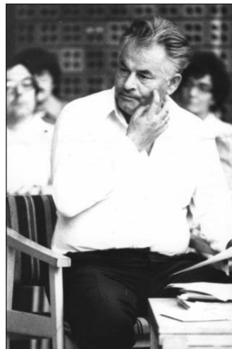
Ratkó József a Hangsúly egyik felvételén