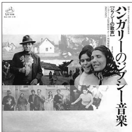
A szabolcsi cigány népzene közreadó japán lemez borítója