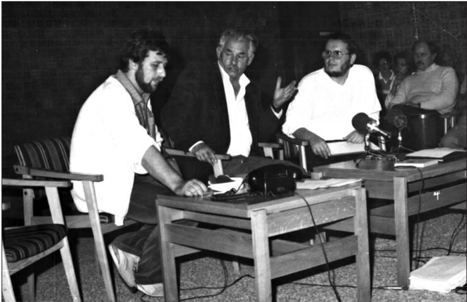
A Hangsúly 15. rádiófelvételén, a háttérben Makovecz Imre építész

– A Hangsúly vége felé a szerkesztők kezdeti lelkesedése alább hagyott. Minden jól ment, mégis inkább már egy szokásos, kötelező körnek tűnt. Nem éreztem bennük azt az elszántságot, mint az első 5–6 adásnál. Amikor a Hangsúly több mint három év után megszűnt, úgy éreztük, hogy nagyon-nagyon űr maradt utána. Kár érte, szép volt. Jó volt együtt dolgozni Ratkó Jóskaékkal.