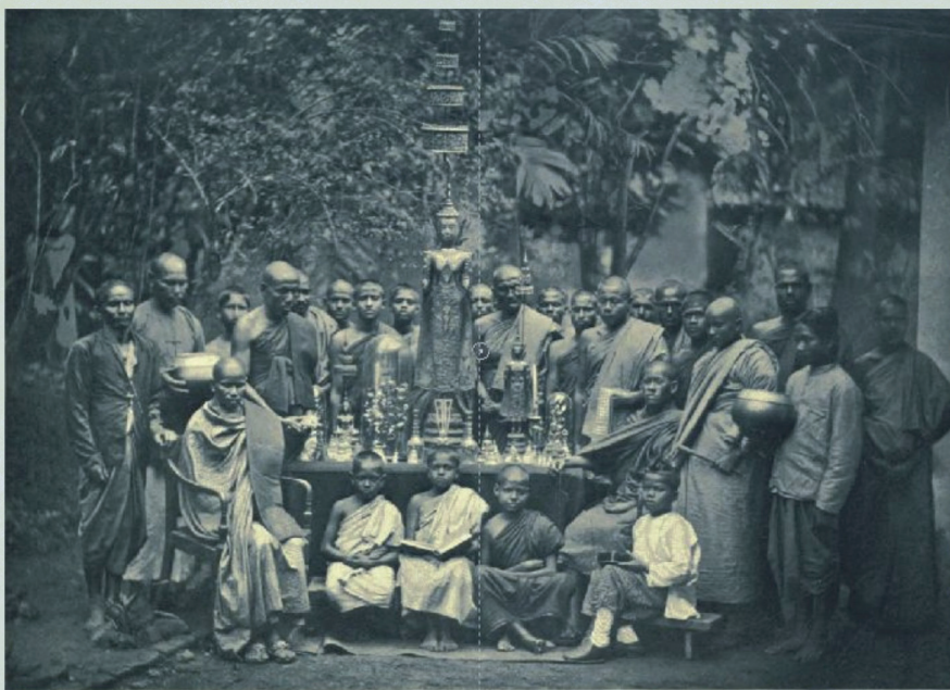
BUDDHIST PRIEST OF CEYLON