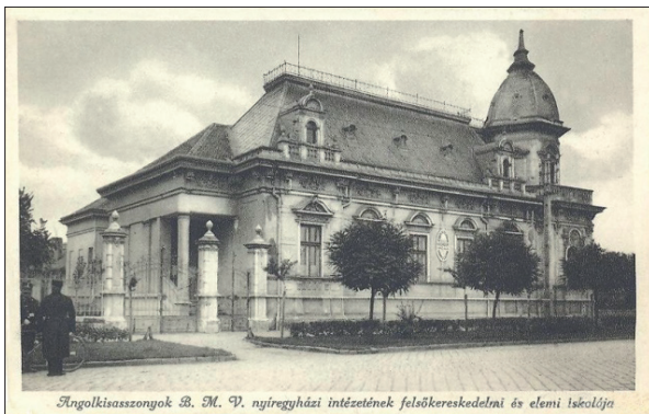
A Gencsy-ház, az intézet egyik otthona a Széchenyi utcán