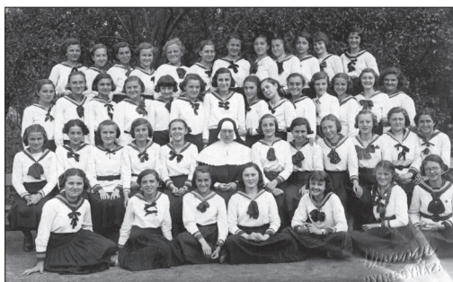
Generációk együtt (1940-es évek)

Tíz évvel később, az 1941. tanévre mind a Kereskedelmi Középiskola mind pedig a Gimnázium tanulói létszáma gyarapodott, miközben a szigorú követelményekből sem engedtek. A kereskedelminek 122 tanulója, gimnáziumának viszont már 216 növendéke volt. 19 Az évkönyvből az utolsó békeév, az 1943–44-es tanév összesen leosztályozott 256 tanulójának vallását, anyanyelvét és nyelvismeretét, a szülők társadalmi összetételét is megtudhatjuk.