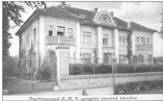
A kollégium („internátus”) a Széchenyi utcán

lenc évvel, 1929-ben az ország kezdett magára találni (majd jött a gazdasági világválság). A korabeli sajtó, mint „új apáca Internátus” címmel mutatta be az intézetet s tette közzé az igazgatóság felhívását – egyébként éppen azon a napon, amikor az első repülőgép is megérkezett a nyíregyházi repülőtérre. 12 Az internátusi díj nem volt kevés: havi 100 pengő. Később 80-90 pengő között változott és a napi ötszöri étkezés mellett a rezsiköltségeket, az orvosi díjat és a német-francia nyelvű társalgást is magában foglalta. A tartásdíját részben természetben, részben