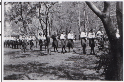
Ballagás az árnyas nyíri fák közt

A leányok az elemitől kezdve a líceumon át egységes keretek között sajátíthatták el az alapvető ismereteket és a művelnőtől elvárható szorgalmat és magatartást.