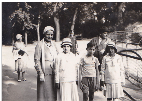
A nyári szalmakalap, a sötétkék szalaggal

Nem mindig hordták szívesen, mégis ízlésformáló és vagyoni különbségeket elfedő szerepe volt az egyenruhának (ismeretes, hogy az angolszász országokban ma is alapkövetelmény). A lányok sötétkék egyenruhát viseltek (volt belőle kettő) rakott szoknyával és hosszított blúzzal. A matrózgallért és magas, legombolható plasztron (ingmell) fekete lapos zsinórral kellett díszíteni. Volt két pár félcipő és a harisnya – csakis feketék. Ékszereket az internátusban a Mária érmen és a karóráan kívül nem is viselhettek. 50 Volt viszont fehér galléros munkakötényük. A kabát is egyforma volt: a téli Nemuann-kabátot kis bársonygallér díszítette, egyensapkájukon ott volt az intézeti jelvény. Nyáron 2 db. fehér-kék csíkos blúzuk volt, legombolható gallérral, plasztronnal és kézelővel, fehér zsinórozással és felvették a csinos szalmakalapot fehér, illetve sötétkék szalaggal. 51