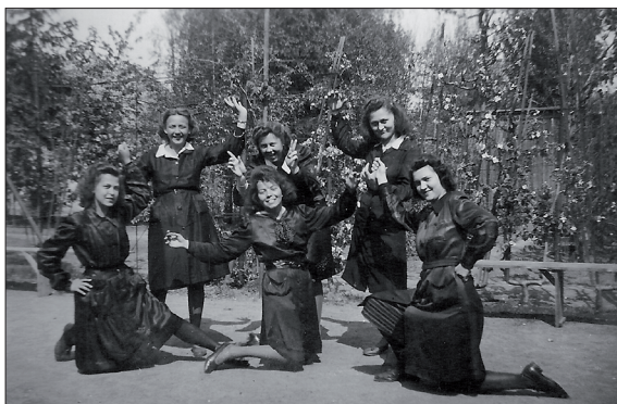
Az Angolkisasszonyok kereskedelmi iskolájának növendékei játssza- nak (1943-ban)