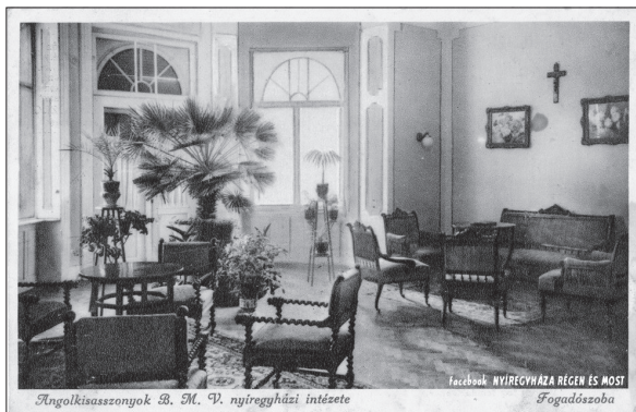
Ahol a szülőket, hozzátartozókat fogadták

Az evangélikus (mint városszalapítók) és a zsidó valamint velük szemben a katolikus válású középosztálybeli rétegek közötti pozíciófeltételekből származó érdekellentét esetenként fel-felbukkant Nyíregyházán (ld. az állami „királyi” katolikus