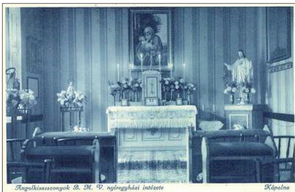
Képeslap az intézet kápolnájáról

A világ egyre hangosabban dörömbölt az iskola kapuján: a máterek tanítványaikkal beszélgettek az olasz és német fasizmusról, menekült osztálytársnak köszönhetően a Szovjetunió félelmes kommunizmusáról. Az Anschlusst, mint vészterhes pillanatot kommentálták tanítványaiknak, – a hangulat 1943-ban Hitler- és fasizmusellenes volt. Így történhetett, hogy 1944-ben a rendház főnöknője a rendelettel szembe helyez-