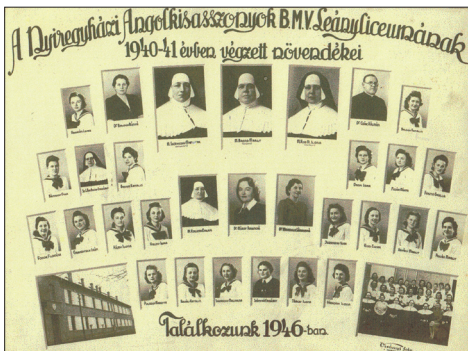
A tablóképen a Báthory utcai épület

épület az 1946/47-es évkönyv szerint összesen 56 diák elhelyezését tette lehetővé. 14