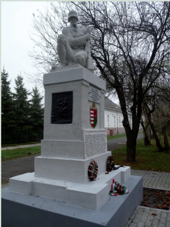
FEHÉRGYARMAT – HŐSI EMLÉKMŰ (FELÚJÍTÁS UTÁN)