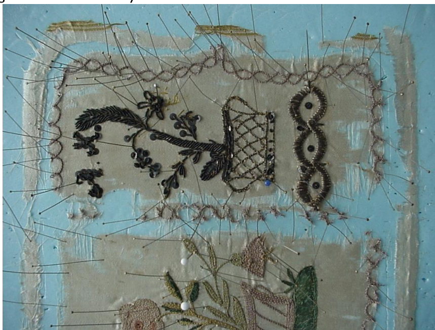
3. ábra: A tárca fedele (szálára igazítás utáni állapot).

vel. Az utolsó díszítmény a tárca fedelén csupán arany és ezüstben pompázott. Fémfonal, flitter, lamella és bouillon hímzéssel készült, amelyek mára feketére korrodálódtak. (3. ábra)