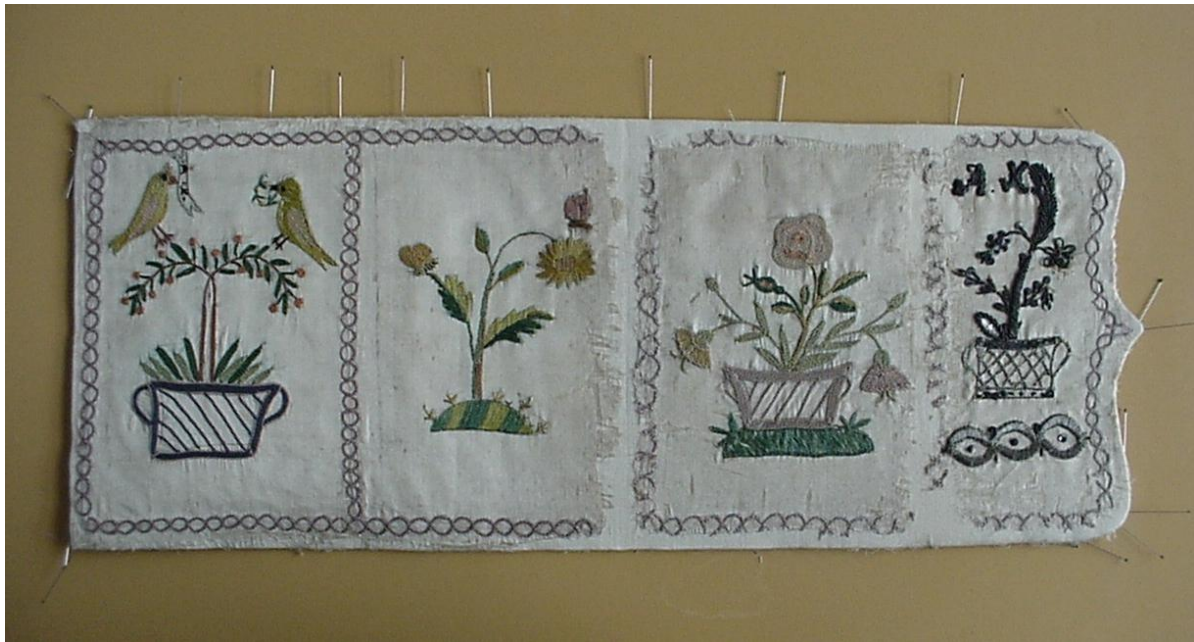
10. ábra: A selyem atlasz borítás visszavarrása az eredeti technika szerint a tárcza merevítő-papírára.