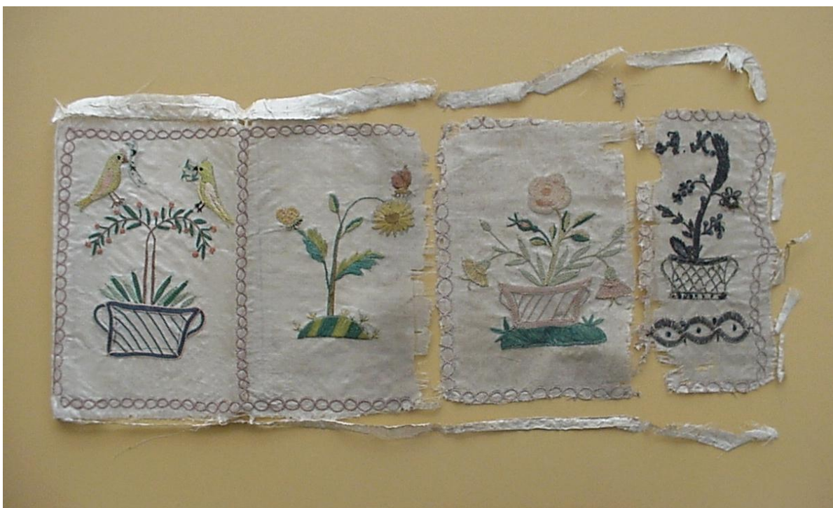
7. ábra: A tárca anyagainak valódi állapota a szétbontás után vált igazán láthatóvá.

A konzervált, részben restaurált tárgy így visszanyerte eredeti formáját, működővé vált (nyitható, csukható), és esztétikailag is jelentősen javult a megjelenése. (12–19. ábra)