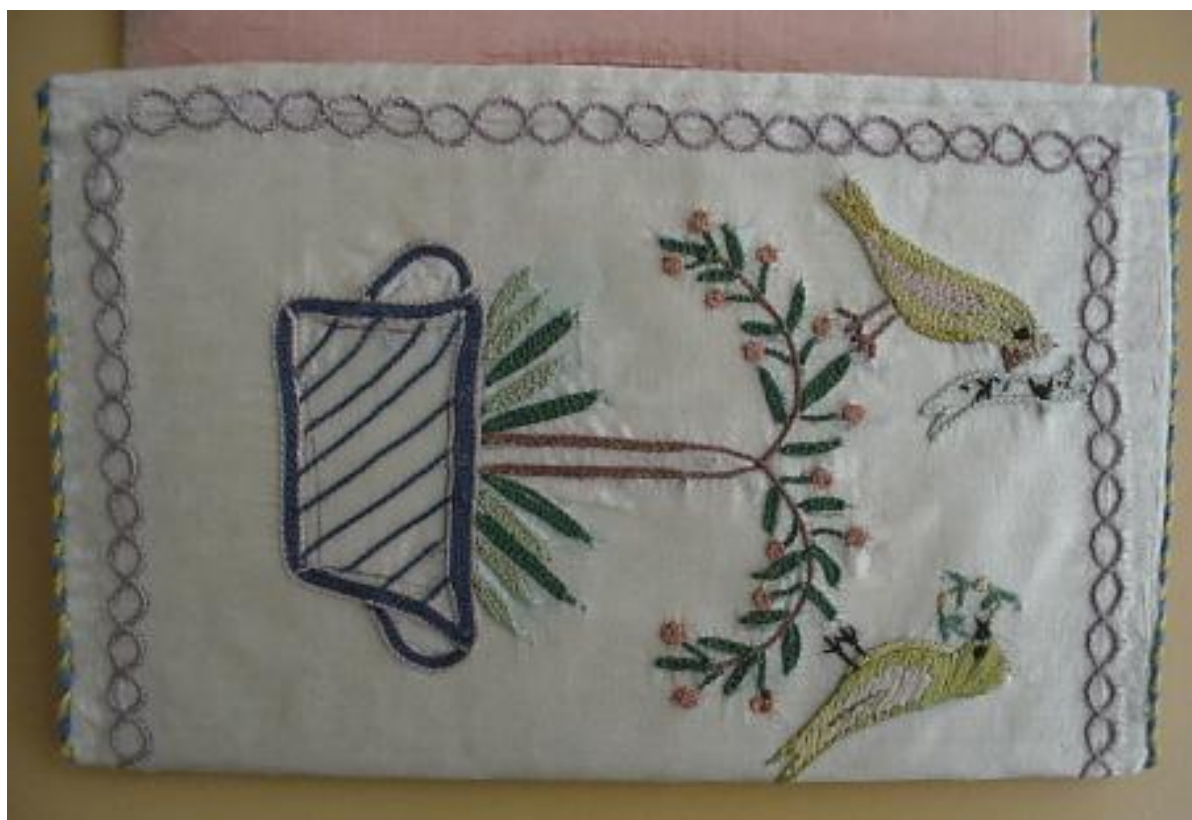
19. ábra: A restaurált tárca részlete.