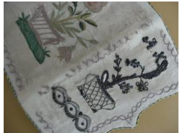
13. ábra: Tárca részlete kezelés előtt és után.