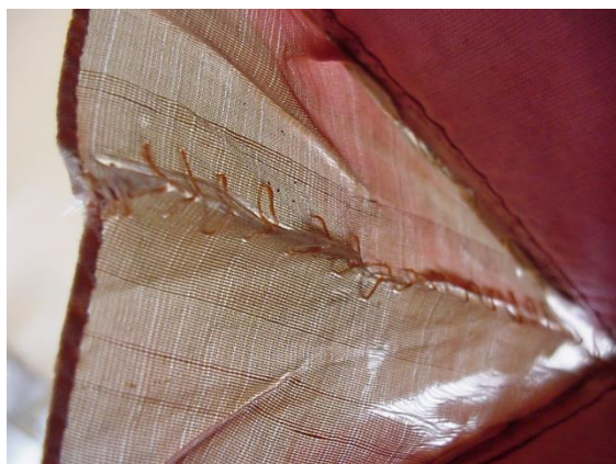
5. ábra: A tárcsa nyitható rekeszének szakadt, kifakult oldalbélése.

Az egész hímzés felületét kisebb, foltos szennyeződések és kopások borították. A rózsaszín selyembélés több helyen kifakult és töredezetté vált. (5. ábra)