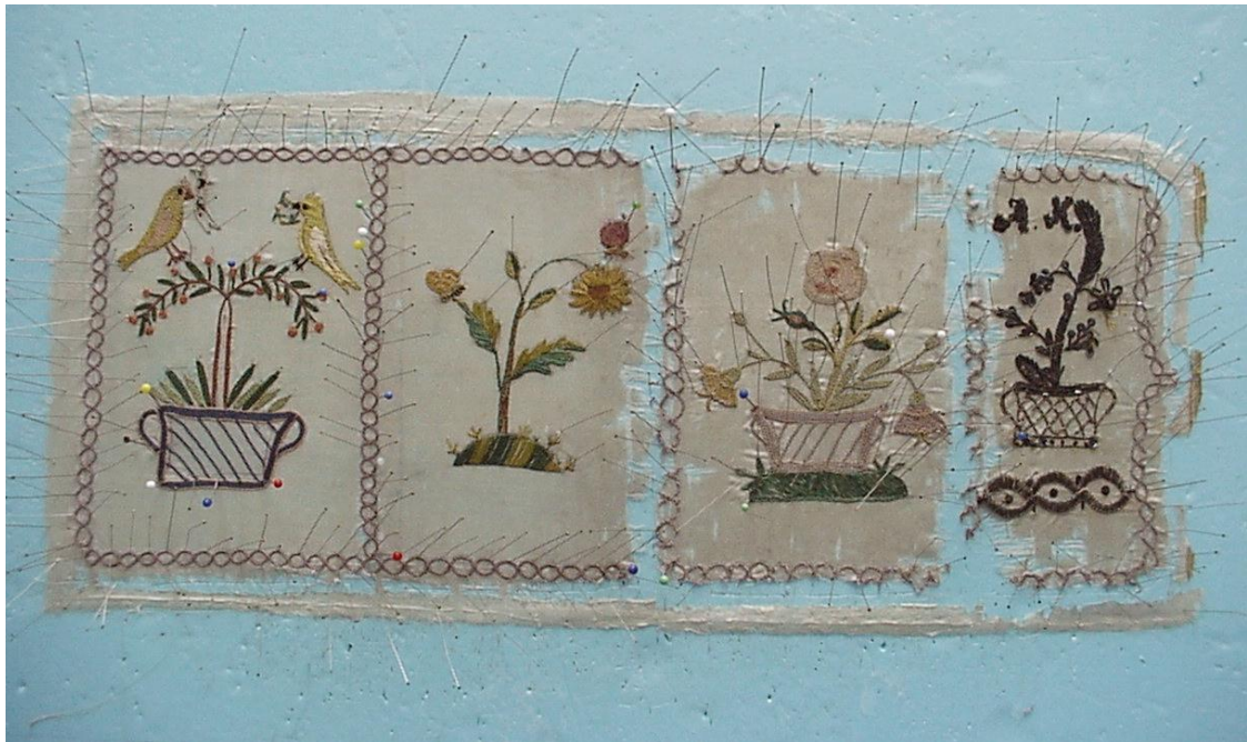
8. ábra: A tárcsa szaténborítása nedvestisztítás, szálára igazítás, kitűzés után.