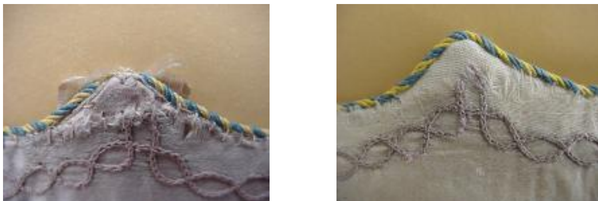
18. ábra: A fedélsúcs állapota konzerválás előtt és után.