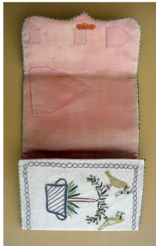
11. ábra: A kinyitott tárcza külső és belső oldala restaurálás után.