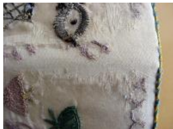
17. ábra: A tárcza hajtott széle a korábbi javítás és a szakszerű kezelés után.