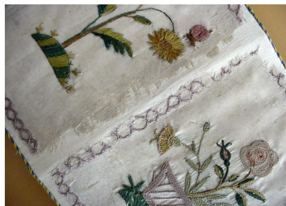
14. ábra: A tárca egyik hajtott éle a műhelybe kerüléskor és konzerválás után.