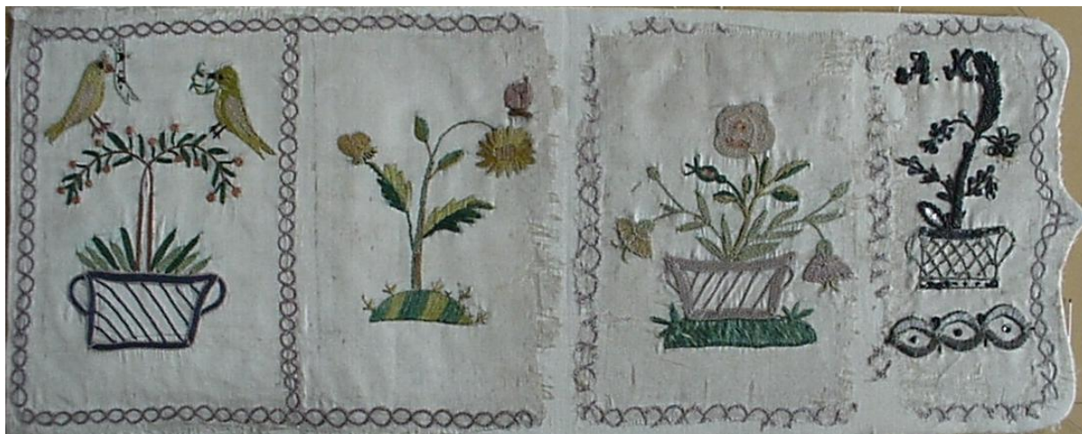
2.ábra: A selymszatén külső borítás kiadja a tárca szabásmintáját.

karikákból álló sorminta határolja el egymástól. Az első elem egy facsetetét ábrázol, két-fülű kosárformájú edénybe ültetve. Piros boggyót érlelő ágaira két oldalt egy-egy madár reppen. Az egyik zöld ágat, a másik egy szalagot tart a csőrében, amelyen az „A. K.” monogram szerepel.