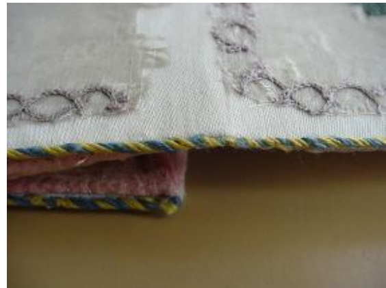
15. ábra: A tárcza zsinórozott széle restaurálás előtt és után.