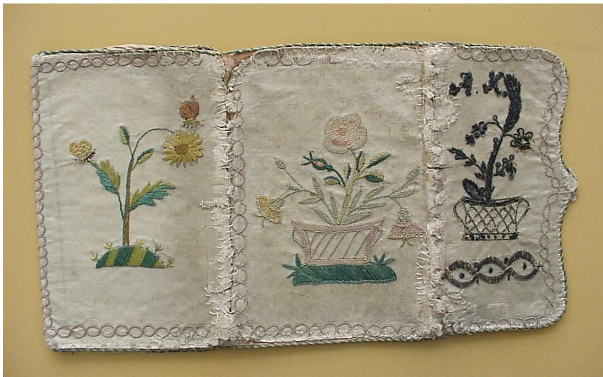
I. ábra: A nyitott tárca külseje

A hímzés ekrü 2 színű selyemszatén alapra színes hímzővel és fémfonalas, 3 lamellás, 4 bouillonos 5 díszítménnyel készült. A tárca formáját és tartását eredetileg a benne lévő papír 6 merevítés adta, amelyet a belső és a külső szaténborítás közé varrtak. A fonák-, azaz a belső oldal rózsaszín selyembélésén lévő kis zsebek és rátétek első szemrevételezésre alkalmasnak tündek kisolló, gyűszű és tűk tárolására, ezért valamiféle varrós-, hímző készlet tartójának gondoltuk – a nyilvántartásban azonban levéltárcaként szerepel, utoljára valószínűleg akként használták. Egy ilyen tárgy birtoklását csak a tehetősebbek engedhették meg maguknak, elkészítése drága alapanyagokat és ügyes kezű, képzett hímzőt igényelt. 7