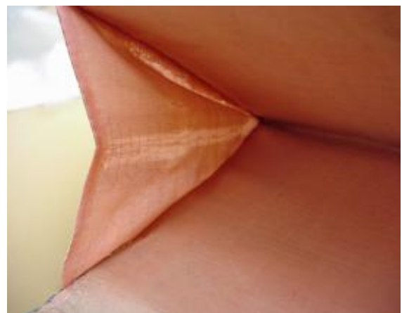
16. ábra: A bélés állapota a korábbi javítással és a restaurálás után.