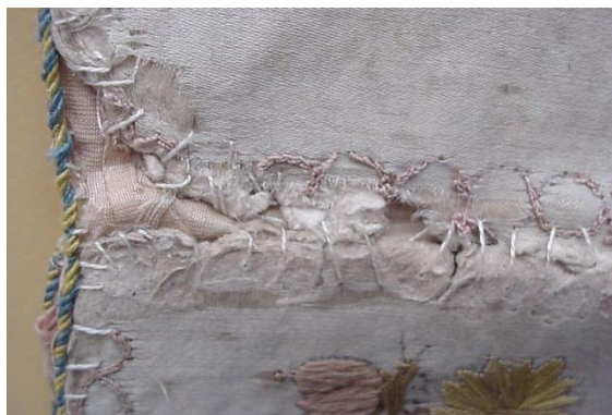
4. ábra: A külső borítás és a papír merevítő hiányai között kilátszik a rózsaszín béléselyem.

A tárcsa a maga korában igen kedvelt darab lehetett, mert a rajta lévő kopások, szakadások zömmel a használatból eredeztethetők. Körben a szélek mentén és a hajtásvonalakban lyukakra kopott a selyemborítás, még a papírmerevítés is olyan rongyossá foszladozott, hogy helyenként csak a belső bélés maradt meg a tárcsa anyagából. (4. ábra)