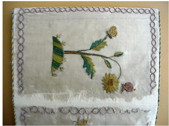
12. ábra: Tárca részlete szálára igazításkor és összeállítás után.