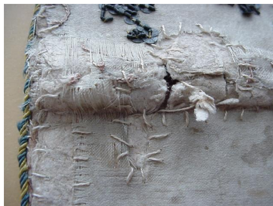
6. ábra: A kiszakadt részeket levarrogatva igyekeztek a foszladozó anyagszéleket megmenteni a további károsodástól.

A szegőzsinór kivételével, ami viszonylag jó megtartású maradt, az egész tárcsa meglehetősen elhasználódott, megrongálódott, rossz állapotba került. Megmentésére korábban a foszladozó részeket fehér fonállal, elnagyoltnak tűnő öltésekkel levarrogatták. (6. ábra) Ennek köszönhető, hogy egyáltalán egyben maradt és később lehetővé vált a konzerválása.