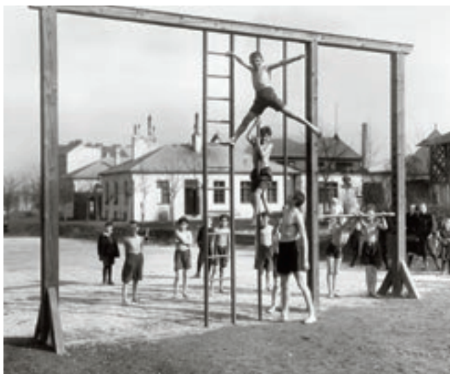
Gimnasztika a Haydn parkban, 1926 körül