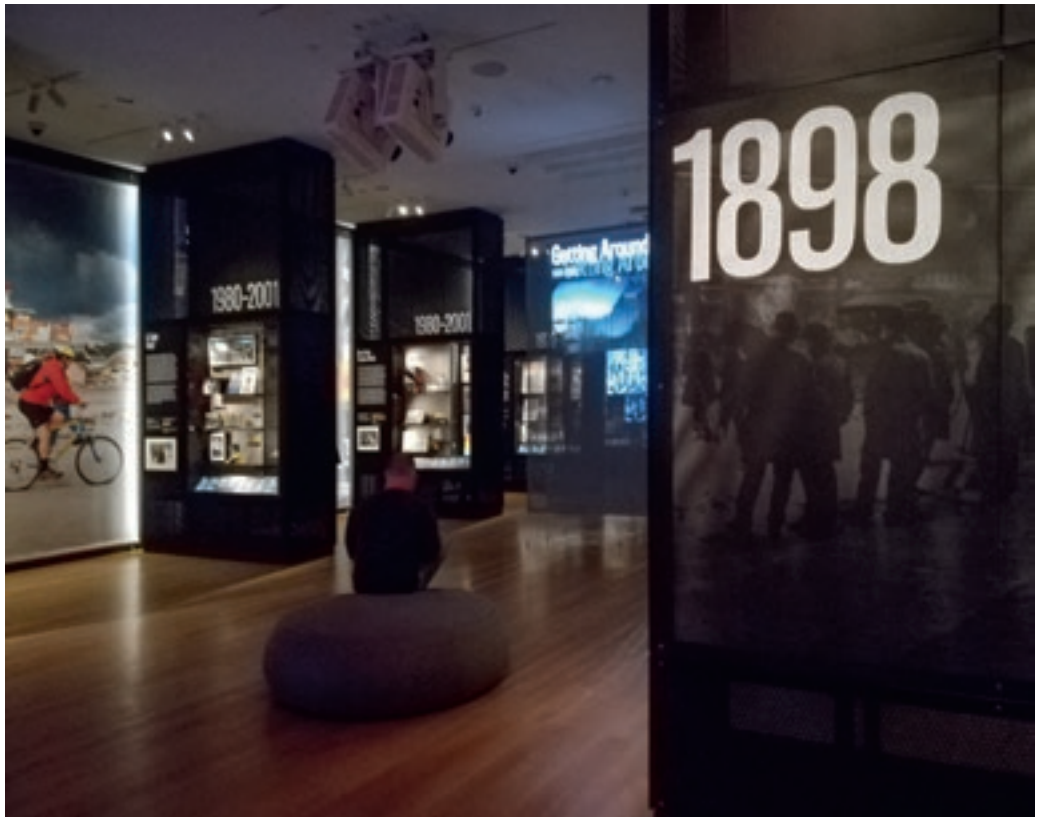
A New York at Its Core állandó kiállítás