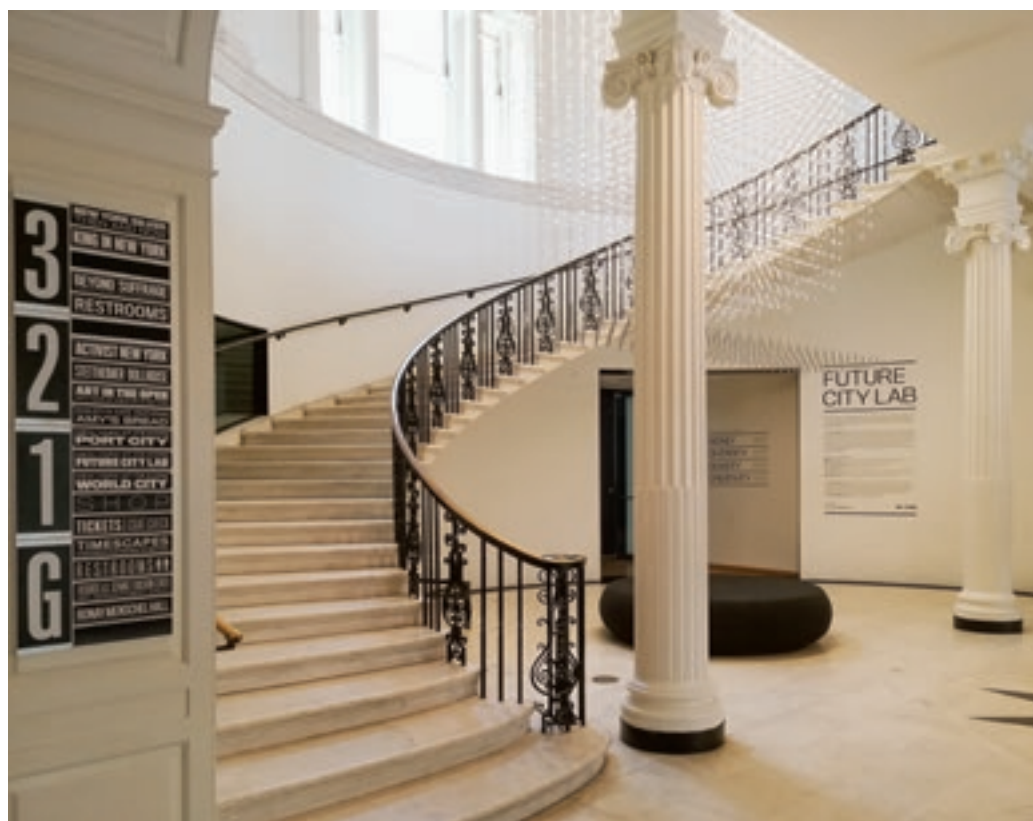
A Cooper Joseph Stúdió „Starlight”-ja az MCNY fogadócsarnokában