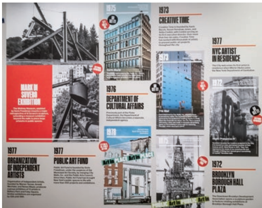
Az Art in the Open – Fifty Years of Public Art in New York című időszaki kiállítás sajátos időszakja