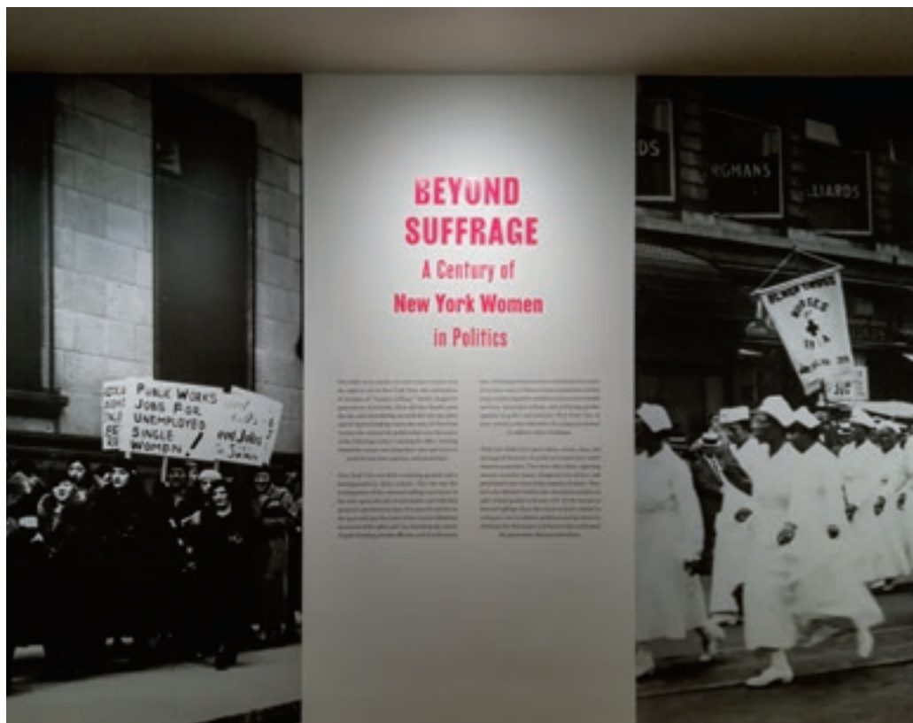
A Beyond Suffrage: A Century of New York Women in Politics című kiállítás a női politikai aktivizmust, a nők politikai és kormányzati szerepének újradefiniálásának folyamatát vizsgálta 2017–18-ban