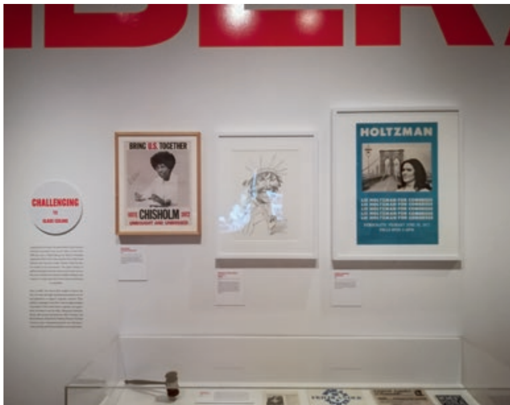
Az MCNY kurátorai nem spórolnak sem a szöveggel, sem a tárgyakkal az időszaki kiállításokon