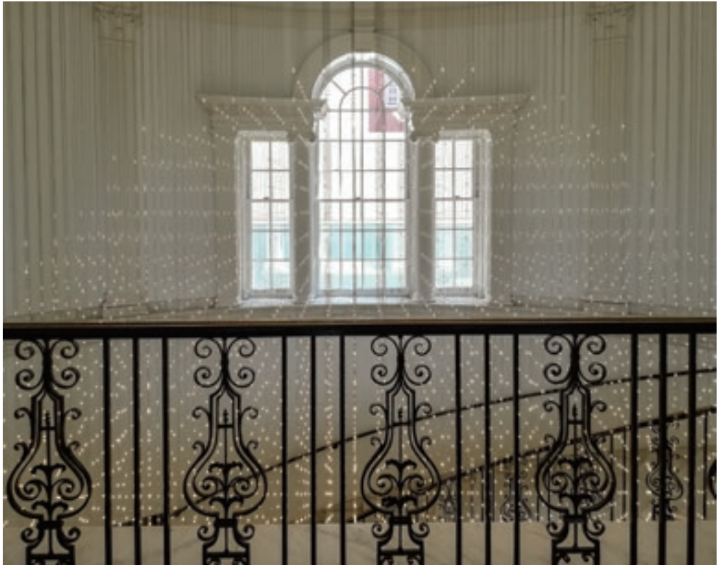
A Cooper Joseph Stúdió „Starlight”-ja az MCNY fogadócsarnokában