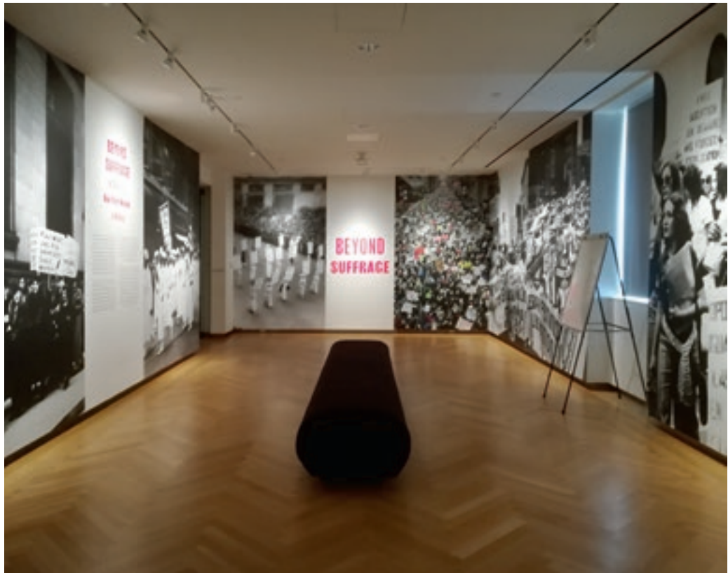
A Beyond Suffrage: A Century of New York Women in Politics című kiállítás a női politikai aktivizmust, a nők politikai és kormányzati szerepe újradefiniálásának folyamatát vizsgálta 2017–18-ban