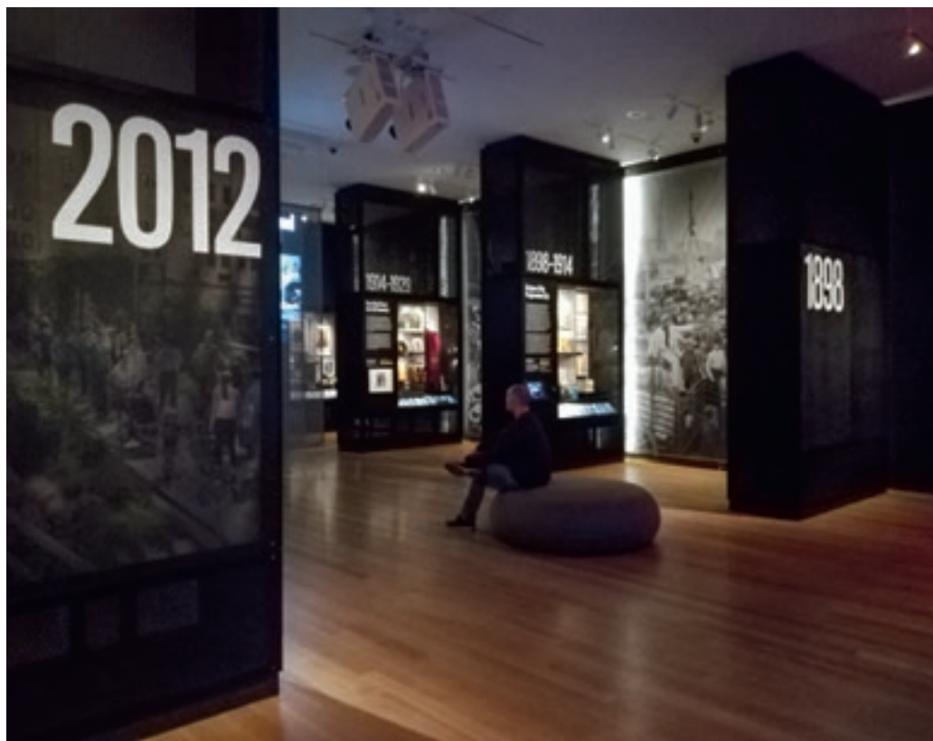
A New York at Its Core állandó kiállítás