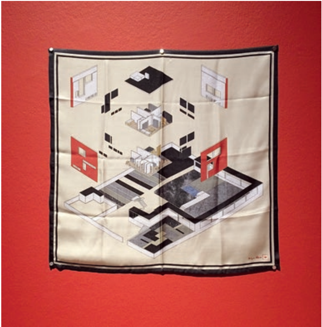
A Molnár Farkas-értelmezések közül: Sógor Ákos axiometria-grafikája, selyemkendőre nyomtatva