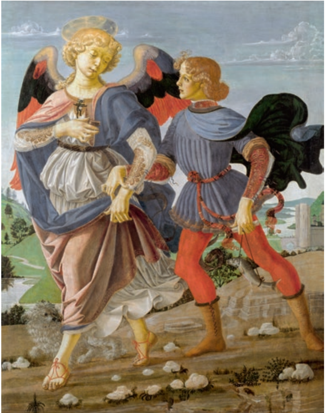
Andrea del Verrocchio és műhelye: Tóbiás és az angyal , kb. 1470–72, London, The National Gallery