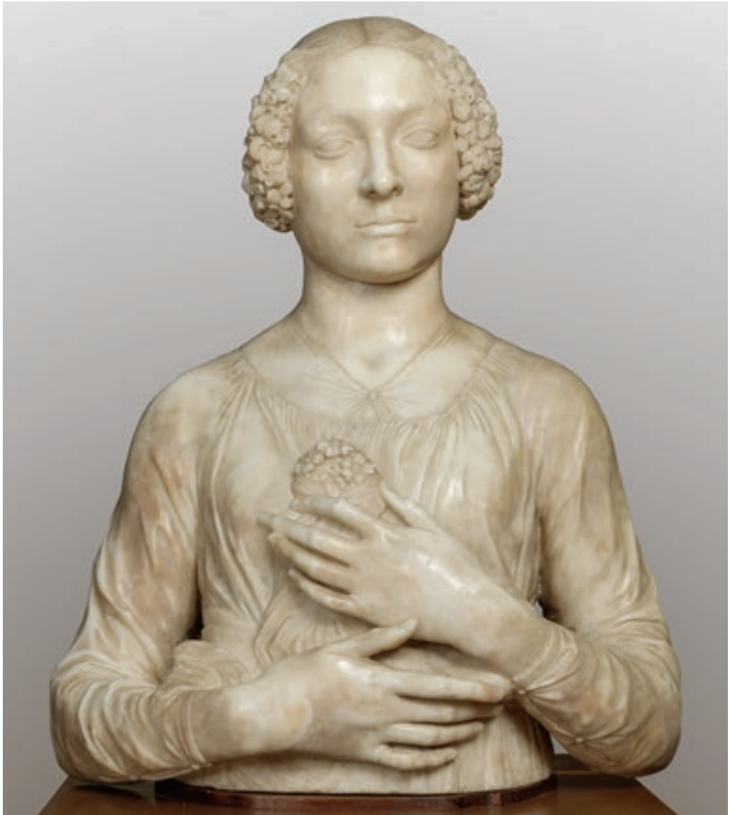
Andrea del Verrocchio: Primulás (kankalinos) hölgy , 1475 Firenze, Museo Nazionale del Bargello