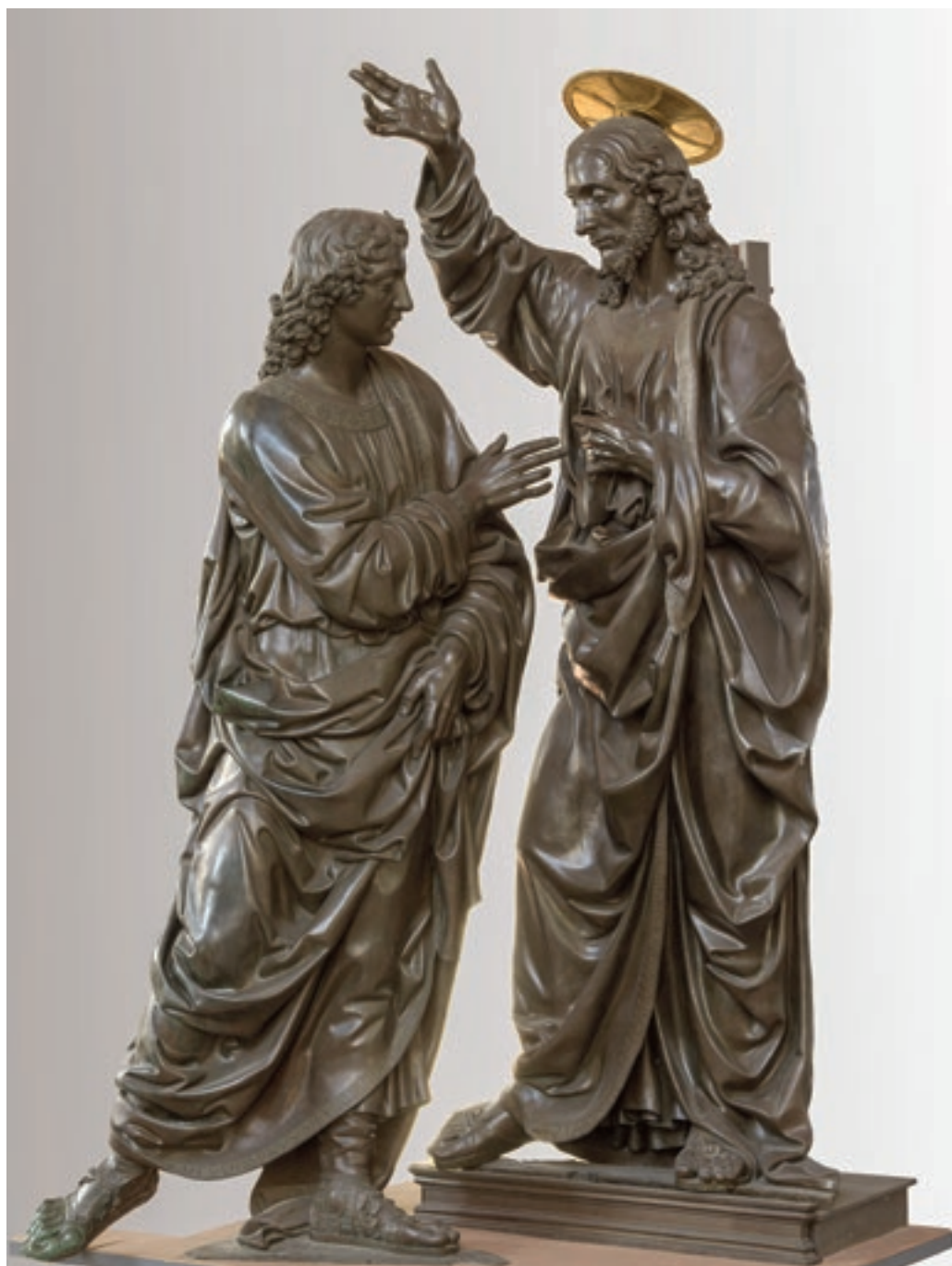
Andrea del Verrocchio: Krisztus és hitetlen Tamás , 1467–83, Firenze, Chiesa e Museo Orsanmichele, Museo Nazionale del Bargello