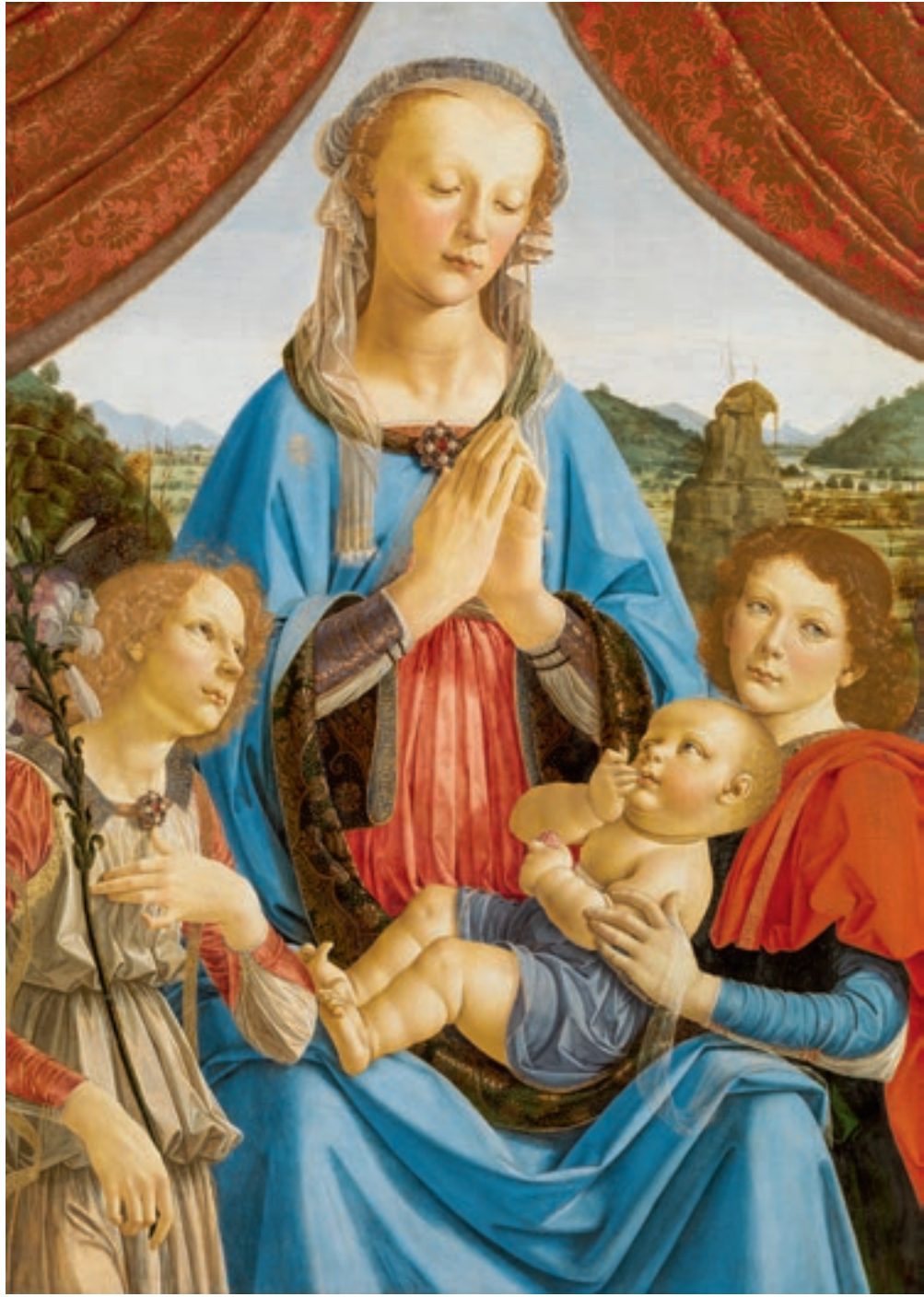
Andrea del Verrocchio: Madonna a Gyermekkel és két anygallal (Volterra Madonna), kb. 1471–72, London, The National Gallery