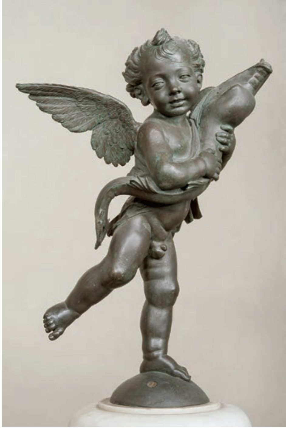
Andrea del Verrocchio: Puttò de'finnel, kb. 1470-75, Firenze, Musei Civici Fiorentini, Museo di Palazzo Vecchio