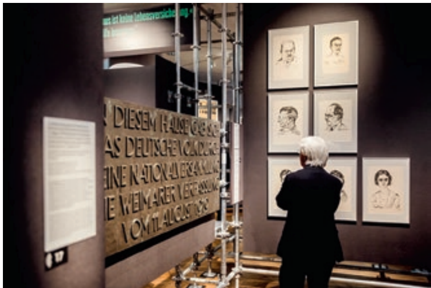
Gropius táblájának kiállított másolata