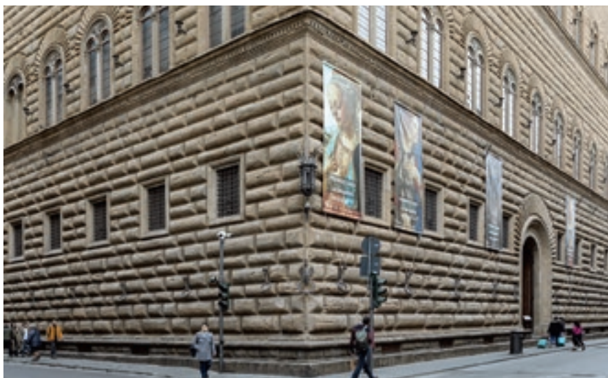
Firenze, Palazzo Strozzi a kiállítás posztterivel Fondazione Palazzo Strozzi