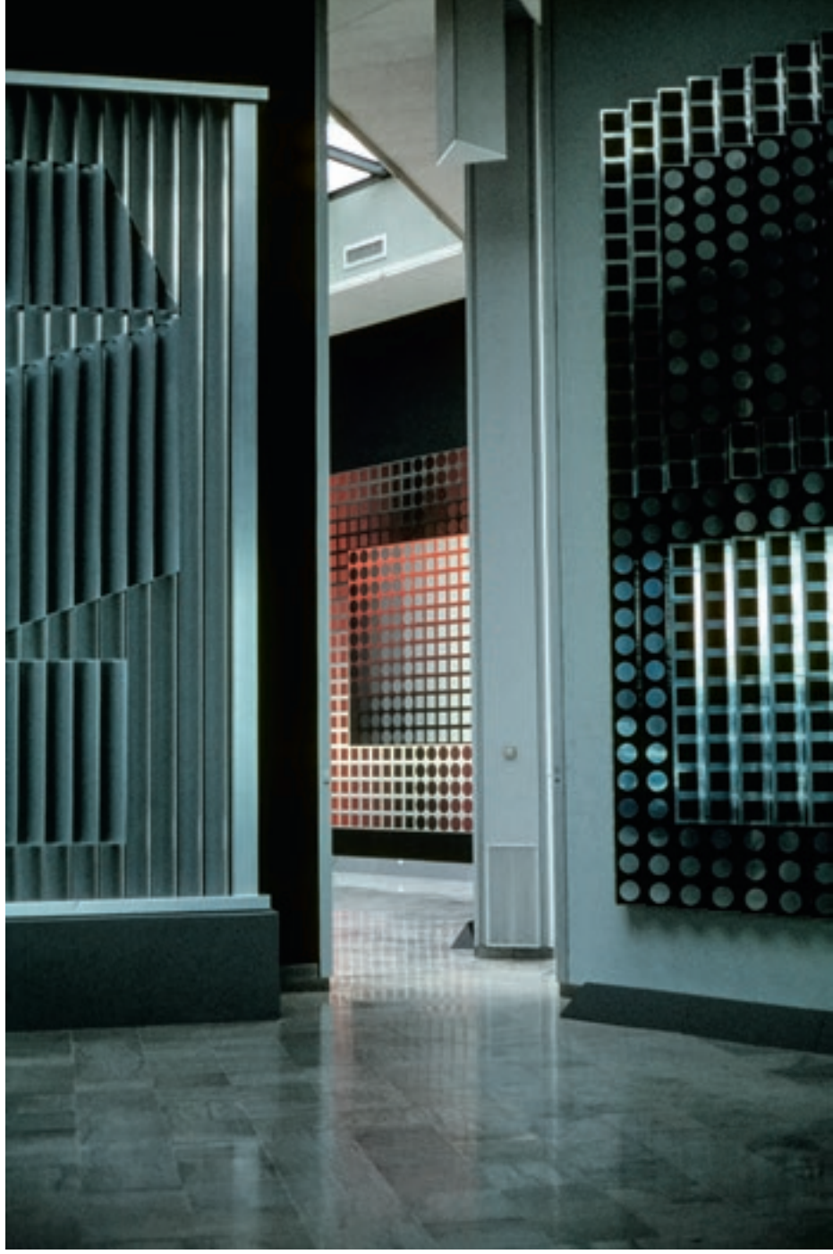
Franciaország, Aix-en-Provence Vásárhelyi Gyűző (Victor Vasarely) magyar-francia festő alapítványi múzeuma, 1977