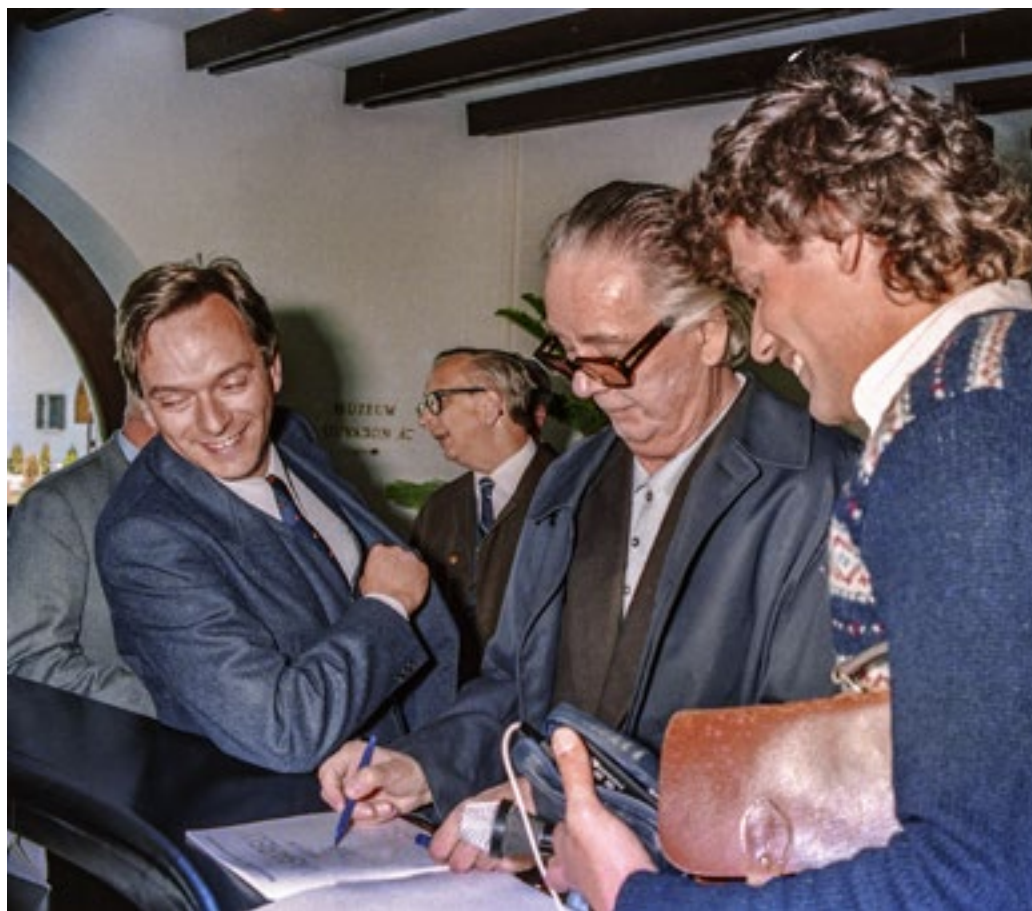
Victor Vasarely katalógust szignál a múzeum megnyitásakor, 1987. május 8.