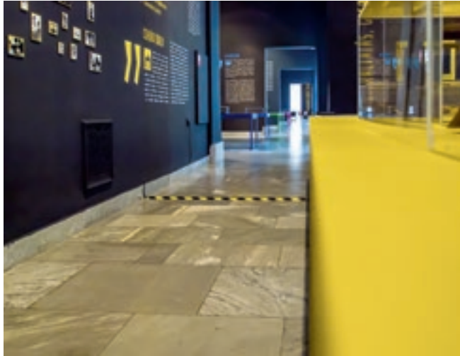
Ellenpedagógia a tóparton – kiállítás a Néprajzi Múzeumban 2015. március 27.–augusztus 31. Kurátor: Frazon Zsófia