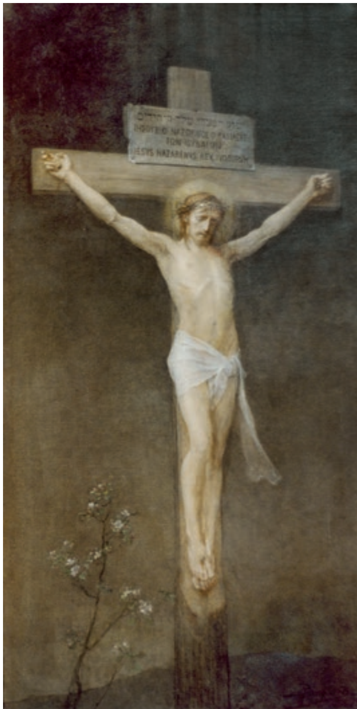
A restaurált festmény