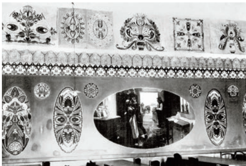
Velten Armand: Az aszódi gimnázium rajztermének ornamentális és figurális díszítése