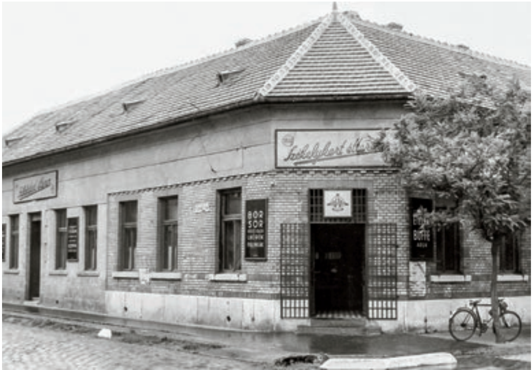
A Székelykert étterem az ötvenes évek végén