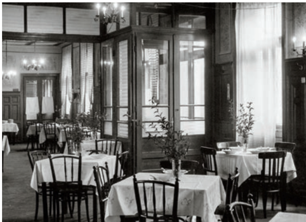
A Székelykert étterem