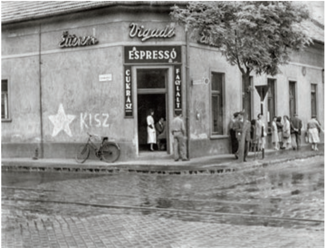
A Vigadó étterem 1958 körül