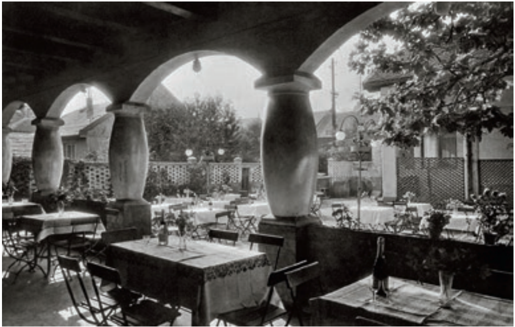
A Székelykert étterem kerthelyisége, 1958