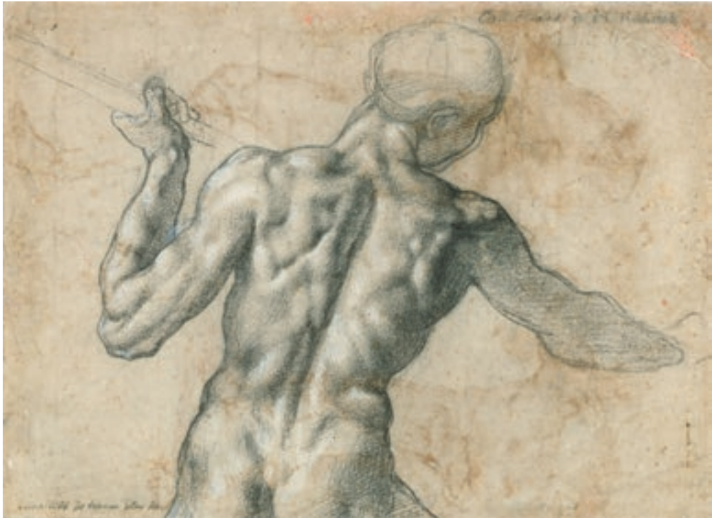
Michelangelo Buonarroti: Férfihátakt , 1504 körül