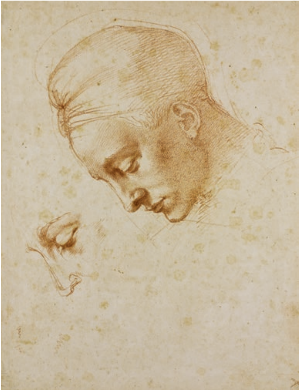
Michelangelo Buonarroti: Fejtanulmány , 1529–1530 körül Fondazione Casa Buonarroti, Firenze.