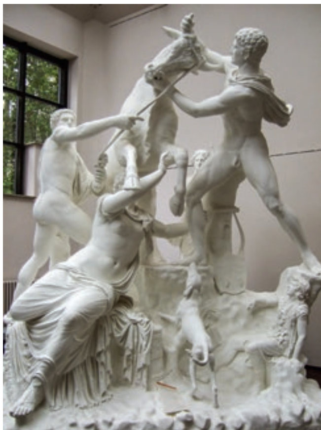
Az antik görög, úgynevezett Farnese-bika gipszmásolata Abguss-Sammlung Antiker Plastik, Berlin