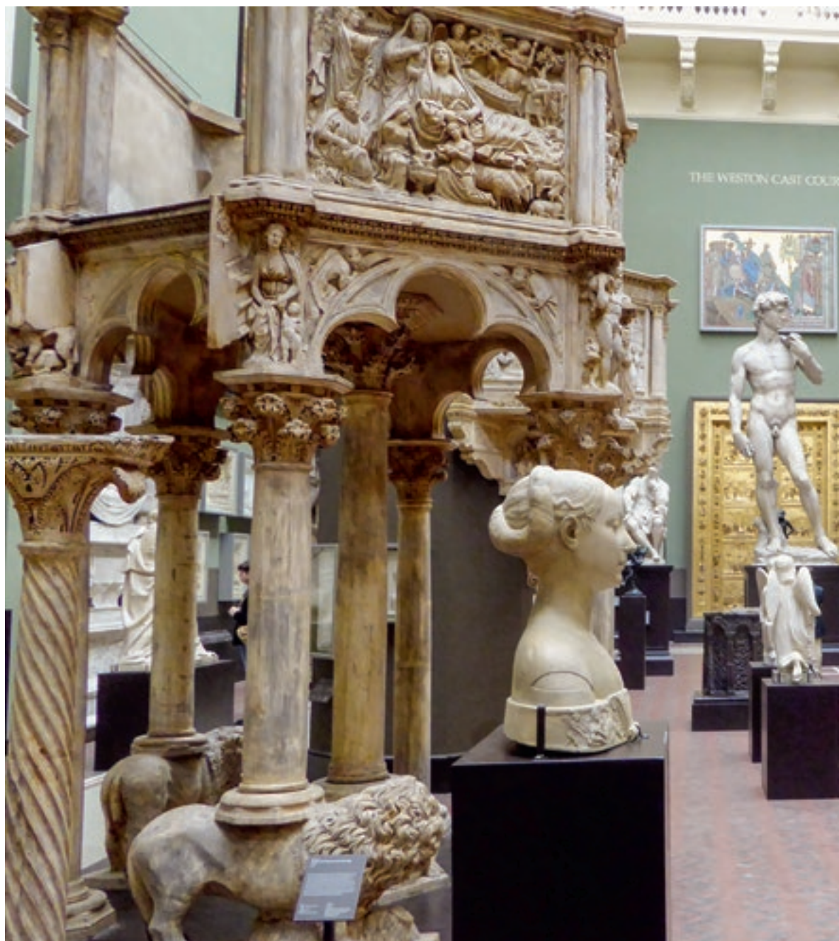
Itáliai szobormások kiállítása Weston Cast Court, Victoria & Albert Museum, London