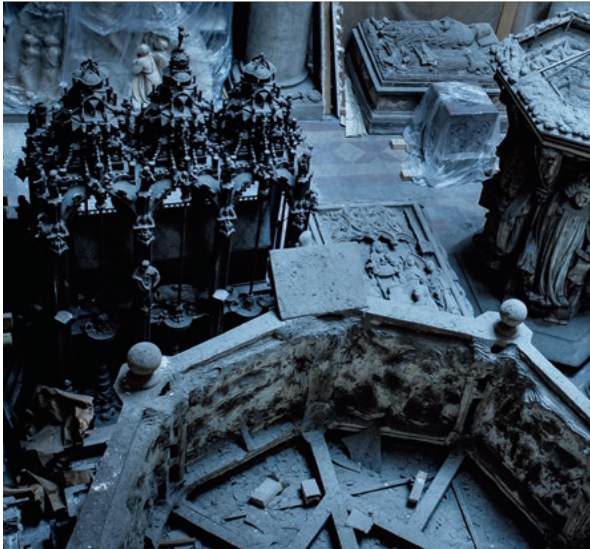
Néhány darab a Szépművészeti Múzeum gipszgyűjteményéből, még a felújítás előtt a Román Csarnokban