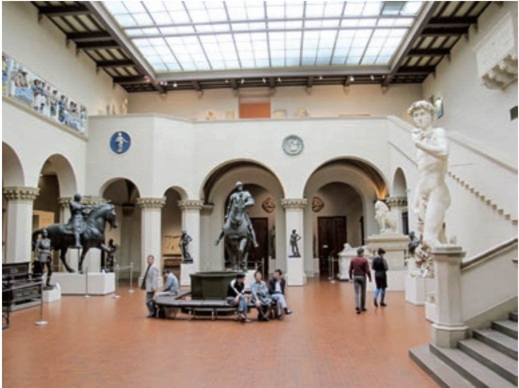
Az itáliai gipszgyűjtemény állandó kiállítása Puskin Múzeum, Moszkva