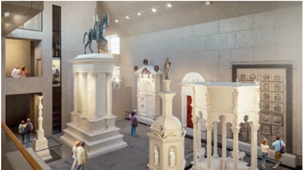
Látványterv a komáromi Csillagerődbe tervezett kiállításhoz Narmer Építészeti Stúdió