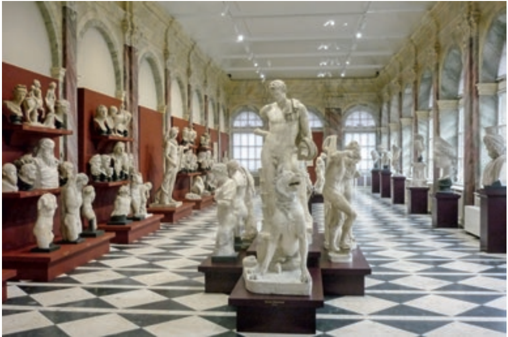
Kiállítás Anton Raphael Mengs egykori gipszgyűjteményéből Mengschen Abgussammlung, Drezda