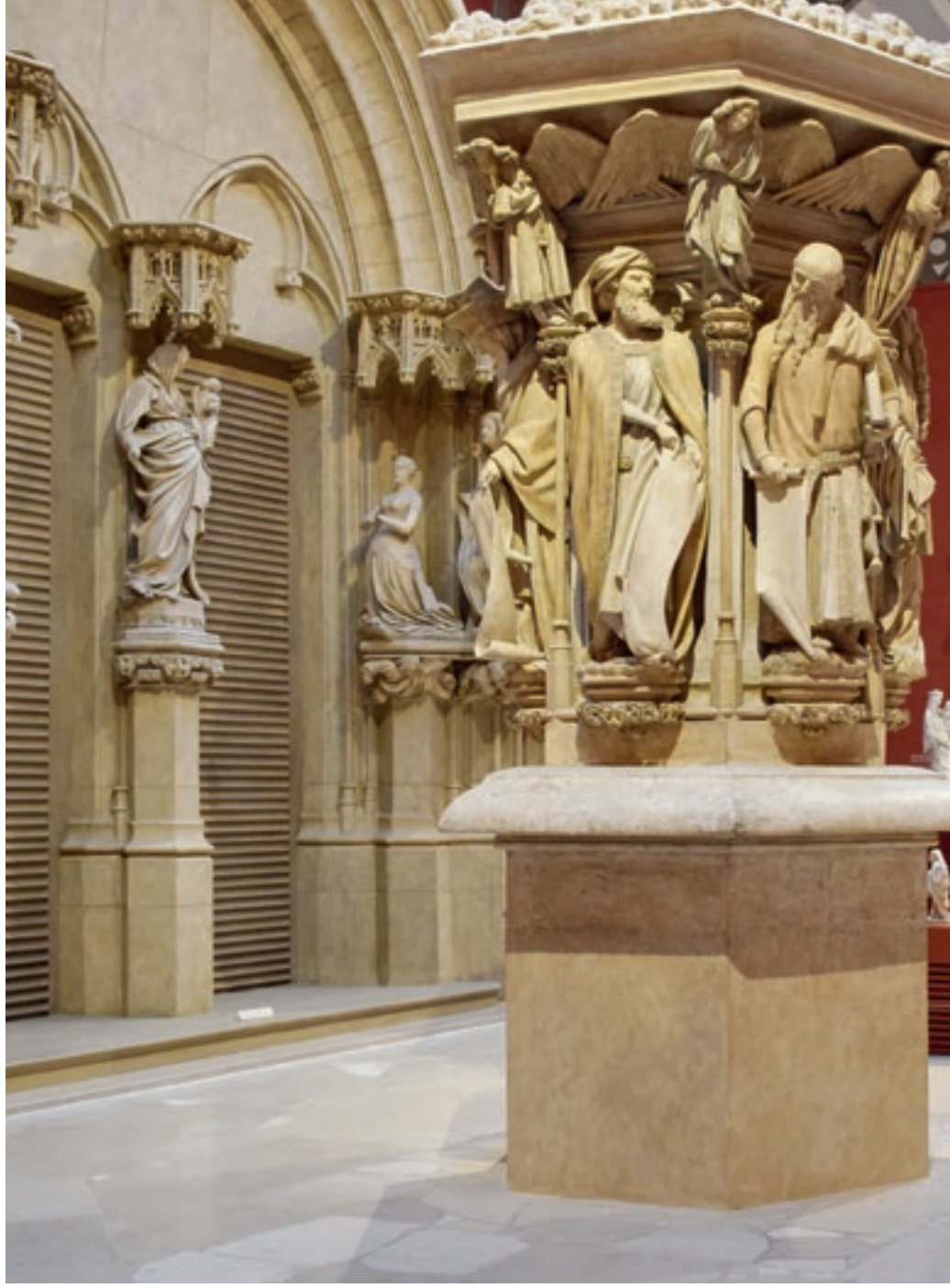
Részlet a francia másolatgyűjtemény állandó kiállításából Cité de l'architecture, Párizs