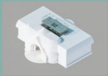
Látványtervek a Szabadság híd projekthez (Studio Nomad/Kultúrgorilla) Ludwig Múzeum