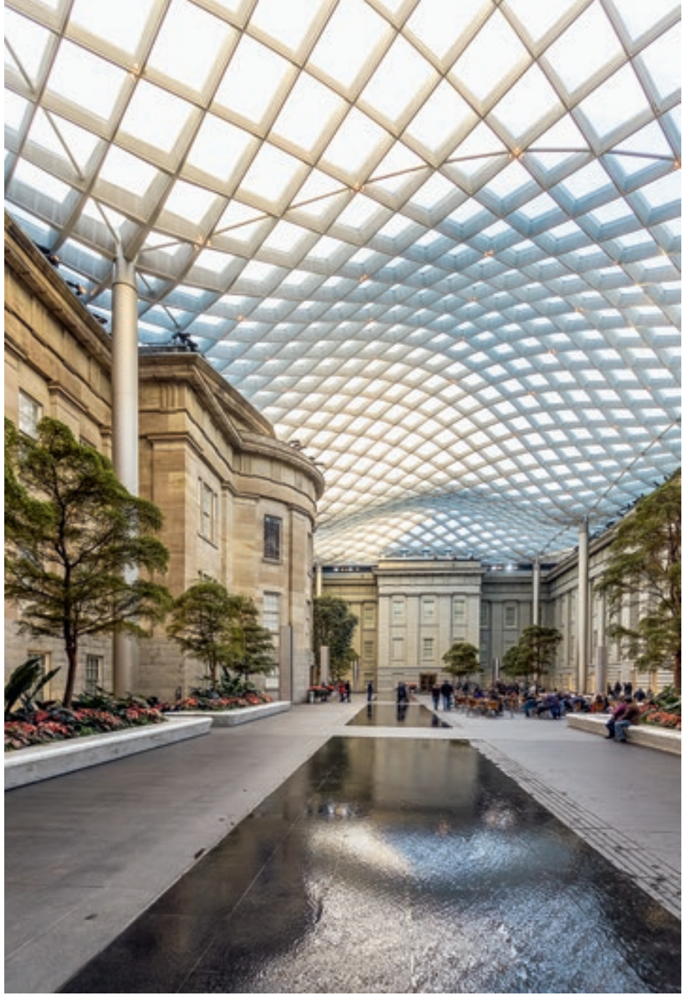
National Portrait Gallery, Washington, a belső udvar