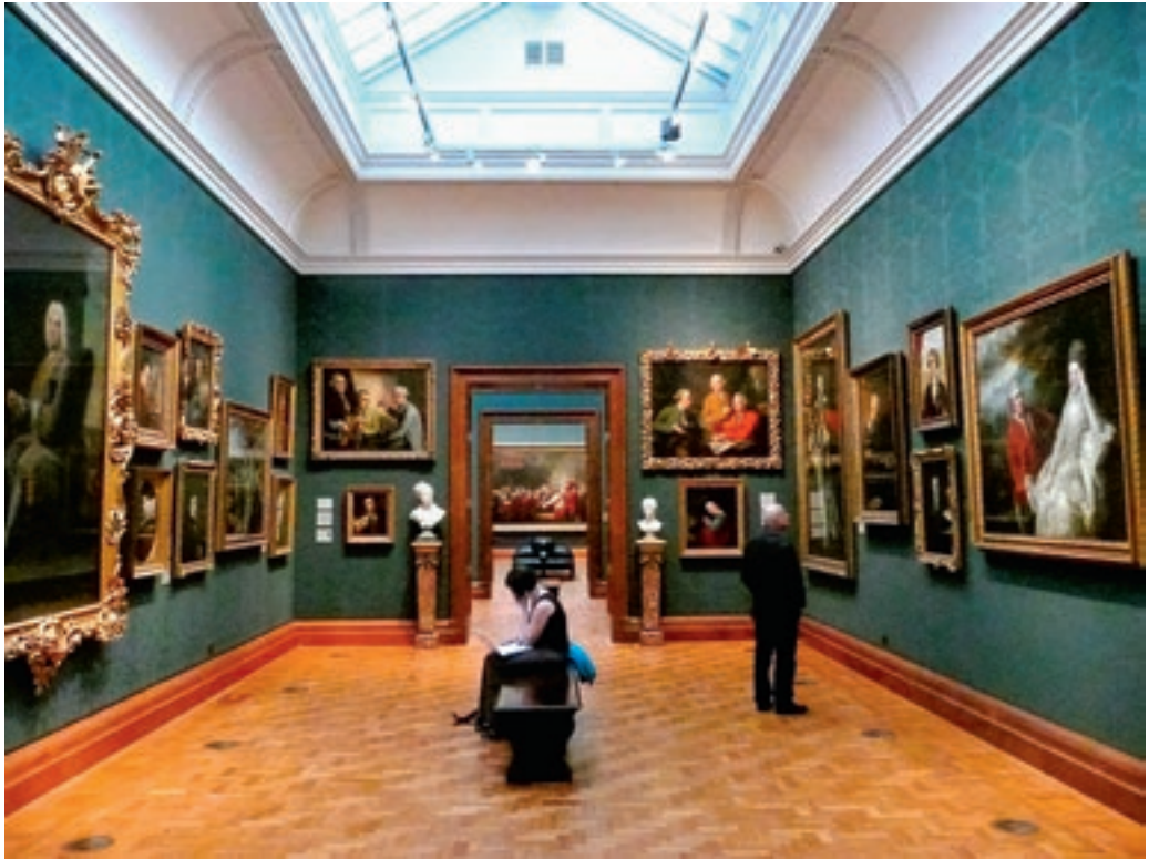
A londoni National Portrait Gallery