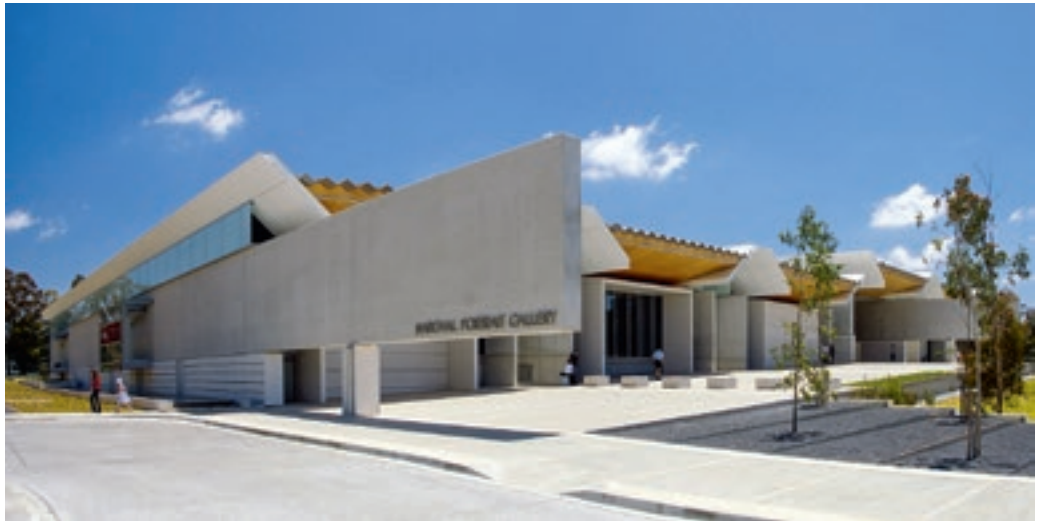
A National Portrait Gallery épülete, Canberra, Ausztrália