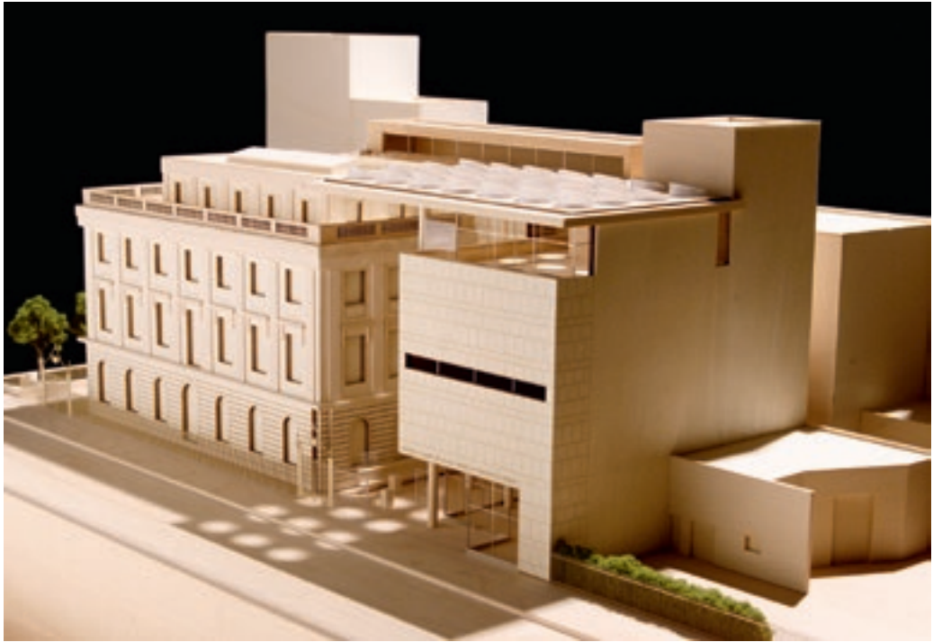
A kanadai National Portrait Gallery, Ottawa makett-terve