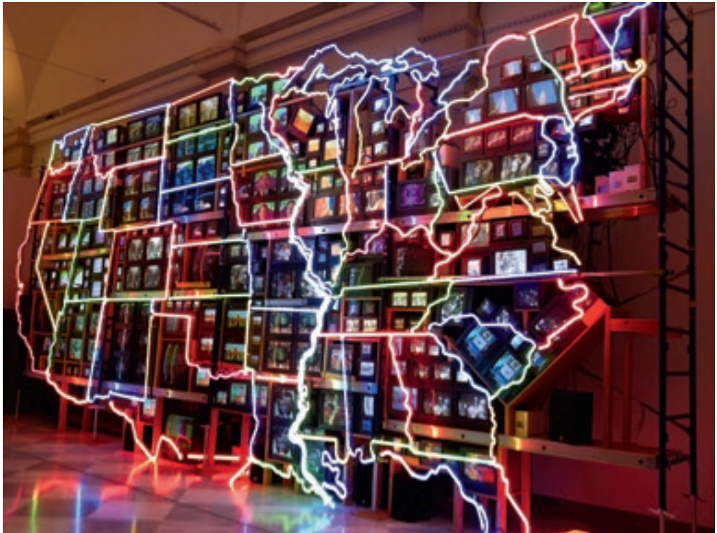
Nam June Paik: Electronic superhighway , installáció. 1995. Washington, National Portrait Gallery