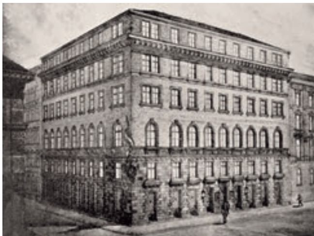
A Társadalmi (Népegészségügyi) Múzeumnak egykor otthont adó épület, a VI. kerületi Eötvös utca 3.