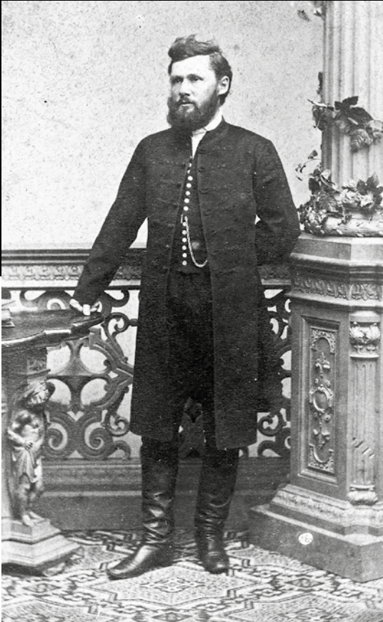
SKUBLICS ISTVÁN fényképe az 1860-as évekből (MNL SML)