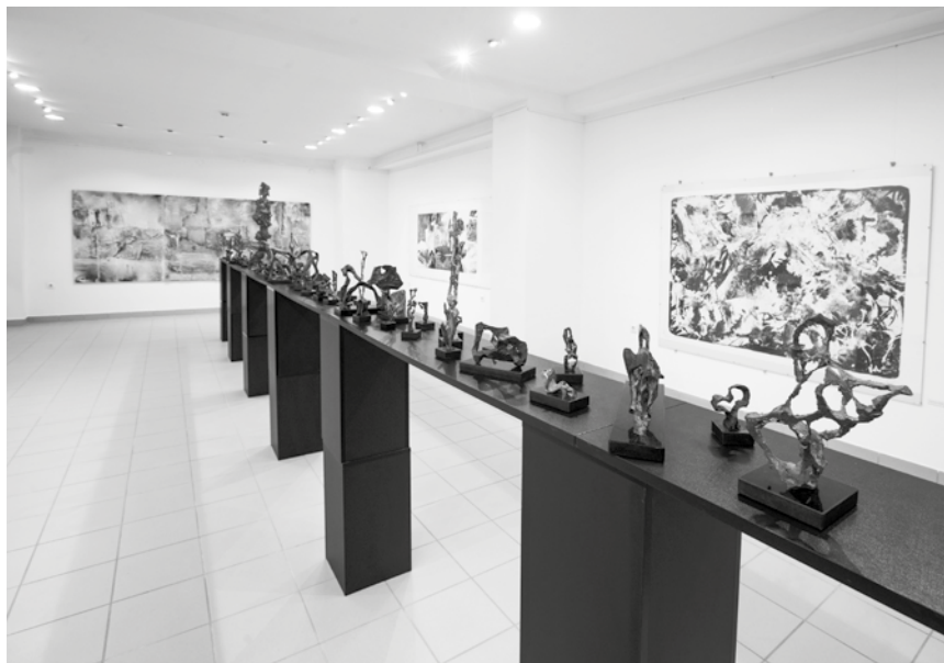
Kiállítási enteriőr a Gönczi Ferenc Galériában – Zalaegerszeg

san kapott megrendeléseket galériáktól, művei pedig a legrangosabb amerikai múzeumok gyűjteményeiben is jelen vannak. Szülőhazájával a rendszerváltás után lett ismét élénkebb a kapcsolata: ezt követően többször hívták ki-