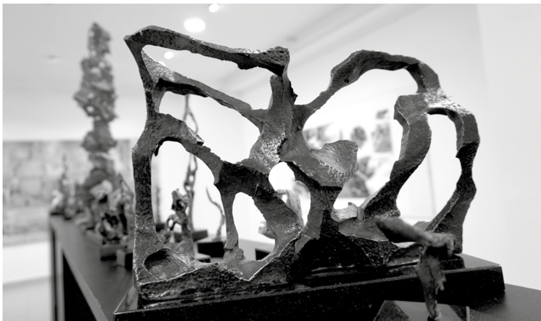
Kiállítási enteriőr a Gönczi Ferenc Galériában – Zalaegerszeg

Hajdu István műkritikus a tárlatnyitón, valamint a kiállítást kísérő katalógusban úgy fogalmazott, hogy a szobrok pusztán a tömegek és formák viszonyát fejezik ki. Leírásukhoz maximum segédszavakat (kapu, torony, penge,