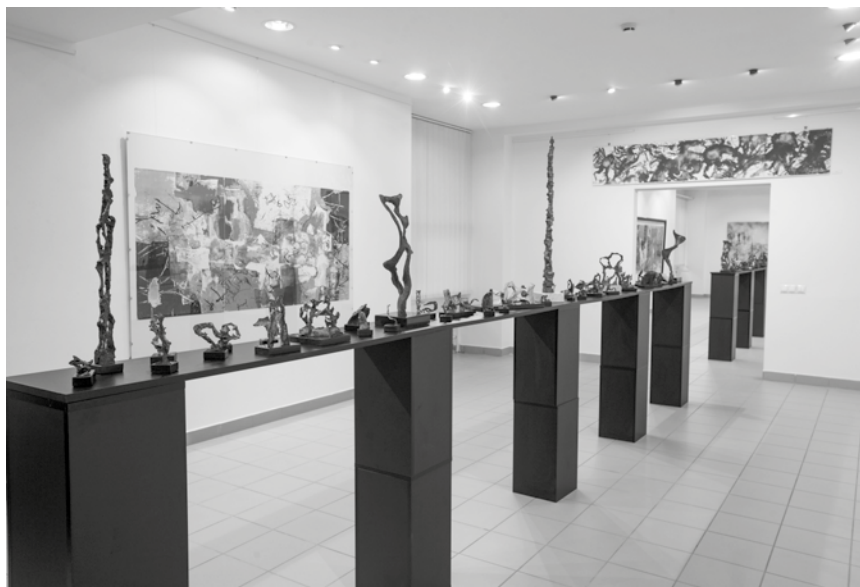
Kiállítási enteriőr a Gönczi Ferenc Galériában – Zalaegerszeg