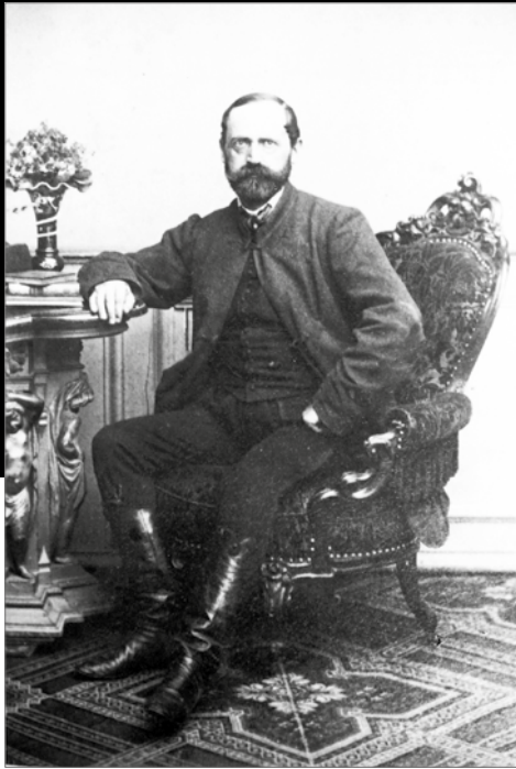
HERTELENDY KÁLMÁN az 1860-as években