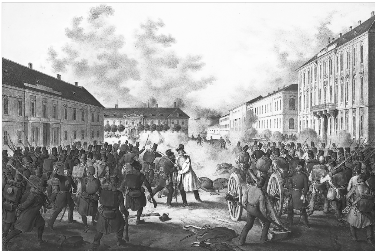
Hentzi cs. kir. vezérőrnagy halálos lövést kap Buda bevételekor, 1849. május 21-én (Matthias Trentsensky színezett litográfiája,)