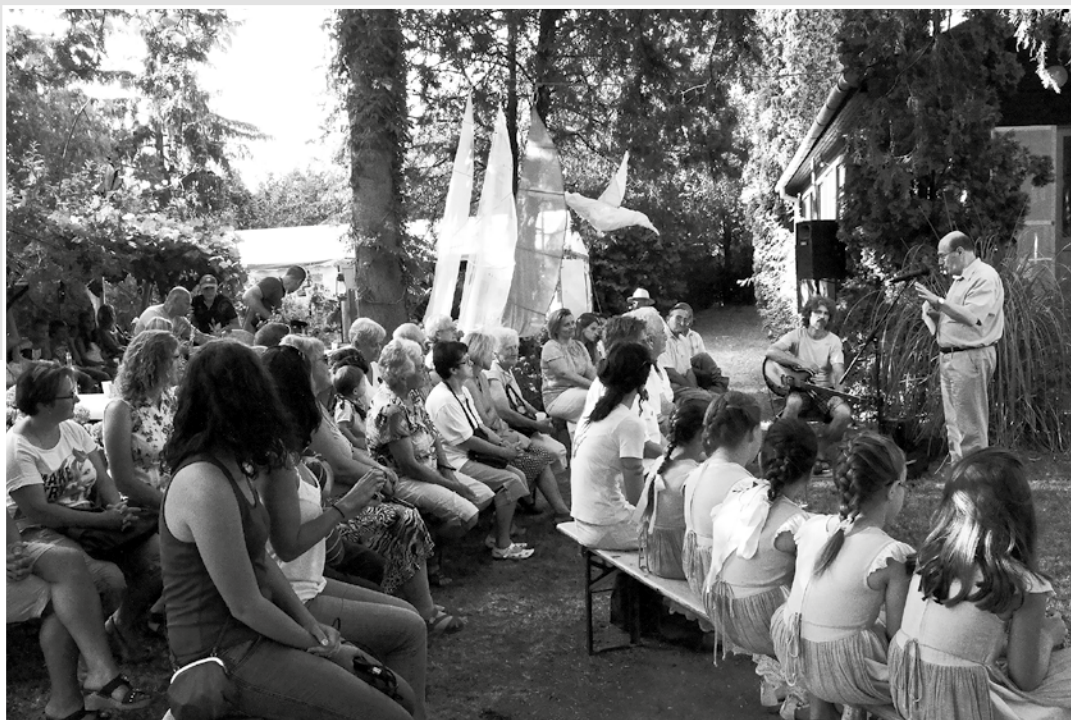
Irodalmi délután a cserszegtomaji kertben

műfaj megfér, akár egyetlen szoba falán vagy terében. Ennek ellentettjeként a giccs, a rossz, a talmi mindenhol disszonáns, hamis, legyen akár a legelőkelőbb a körítése.