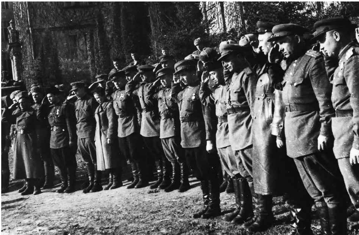
Bajtársai tisztelegnek egy szovjet őrnagy temetésén Zalaegerszegen, 1945 áprilisában

Magyarország határait és elkeseredett harcok kezdődtek Észak-Erdély birtoklásáért. Az ország keleti határvidékén nem sikerült megállítani a szovjet előrenyomulást, október 6-án pedig Arad térségéből kiindulva a Tiszántúlon bontakozott ki egy nagyszabású támadó hadművelet, mellyel kezdetét vette a hónap végéig elhúzódó debreceni (vagy alföldi) páncéloscsata. Horthy Miklós kormányzó október 15-i kiugrási kísérlete kudarcba fulladt, az ország irányítását pedig német támogatással a Szálasi Ferenc vezette Nyilaskeresztes Párt ragadta magához. 6 A hatalomra került nyilasok a végsőkig tartó harcra kívántak berendezkedni, ennek jegyében próbálták mozgósítani az ország még meglévő anyagi és emberi erőforrásait. A nyilasok fanatizmusát jól jellemzi Zala megye nyilas főispánjának, Csomay Miklósnak az 1944. november 30-i vármegei értekezleten tett kijelentése. A sajtó tudósítása szerint a főispán az összegyűlt járási főszolgabírók, polgármesterek és a különféle hivatalok vezetői előtt „teljes felelősségének tudatában bejelentette, hogy a Német Birodalom [...] ezt a háborút 1945. április 1-ig