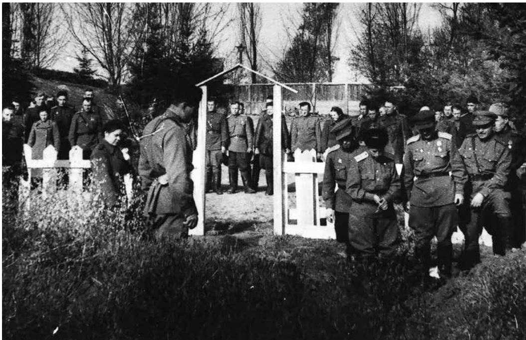
Szovjet őrnagy temetése Zalaegerszegen 1945 áprilisában

ítélt magyar politikusokat és egyszerű állampolgárokat, 2 a keleti frontra rövidesen újabb honvéd csapatokat küldtek, 1944 májusában pedig elindultak az első vonatszerelvények Auschwitz felé. 3