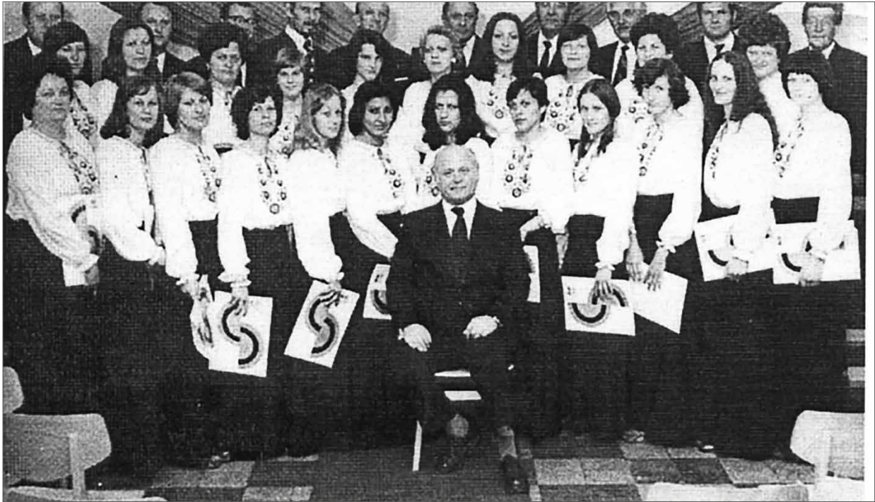
A zalaegerszegi Ruhagyár kórusával – 1975

a felkérést a Zalaegerszegen ezekben az években indított Liszt Ferenc ének-zene tagozatos iskola igazgatói teendőinek ellátására. 1972-ben a Kertvárosban épült új általános iskolával összevonásra került intézménye, ahol a továbbiakban nyugdíjazásáig a zenei tagozatot irányító igazgatóhelyettesként dolgozott. Oktatási-pedagógiai pályájának első szakaszai egybeestek az elemi iskola helyett bevezetett nyolcosztályos általános iskolai képzés indításával. A felső tagozaton való tanításhoz vállalta a továbbtanulást is. A Pécsi Állami Pedagógiai Főiskolán 1956-ban matematika-fizika, majd 1962-ben ének szakos általános iskolai tanári képesítést szerzett – munka mellett levelező tagozaton – kiváló eredménnyel.