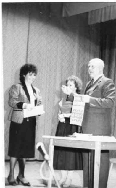
A pákai dalostalálkozó zsűrielnökéként /1988/

összefüggő tevékenysége Nován teljesedett ki, ahol 1951-től megkezdte Göcsej népdalkincsének addig csak kis mértékben feltárt gyűjtését. Ehhez ösztönzést kapott a Magyar Tudományos Akadémia Népzenekutató Csoportjától. 1953-ban egyhónapos népzene gyűjtőknek szervezett országos továbbképzésen egészítette ki szakmai ismereteit az addig autodidakta módon, de elismerten jó színvonalon végzett munkájához. Néhány évig csak Nován, majd a környékbeli falvakban, a Cserta mentén dolgozott. 1961 után Zalaegerszegre kerülve kutatási területe kiterjedt a város környéki falvakra, majd a megye egész területére.