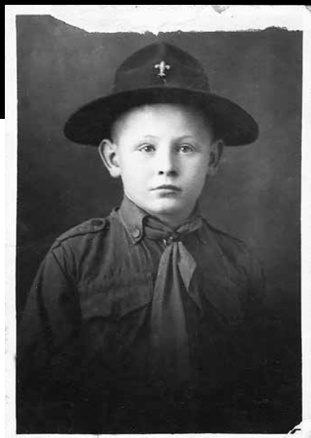
Kiscserkész egyenruhában – 1930