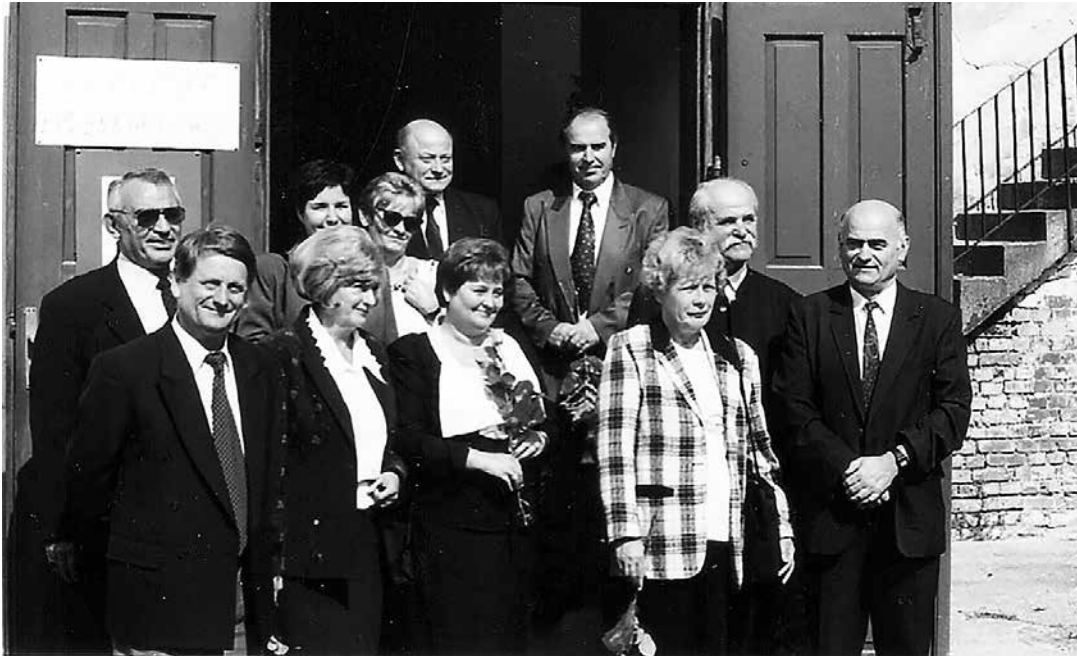
A novai iskola avatásán 2001-ben (a képen látható személyek: gyermekei párjaikkal és testvére)

Pozitív tulajdonságai, személyiségének kedvező sajátosságai is segítették sikeressé és hatékonyá tenni működését minden területen. Munkáját szorgalom, kitartás, hivatásszeretet, magasfokú elkötelezettség jellemezte. Embersége, kiváló kapcsolatteremtő képessége eredményezte, hogy tanítványaival, azok szüleivel, a népdalgyűjtés során a legkülönbözőbb emberekkel hamar bensőséges viszonyt tudott kialakítani. Önzetlen segítőkészség, jó kollegiális kapcsolatok jellemezték. Pontos és következetes volt. Ez tette lehetővé, hogy kötelező tennivalóin kívül a rengeteg önként vállalt feladatát is teljesíteni tudta.