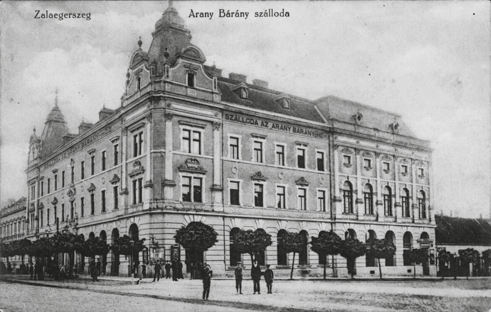
Az Arany Bárány szálloda egy képeslapon 1930 körül (Göcseji Múzeum)