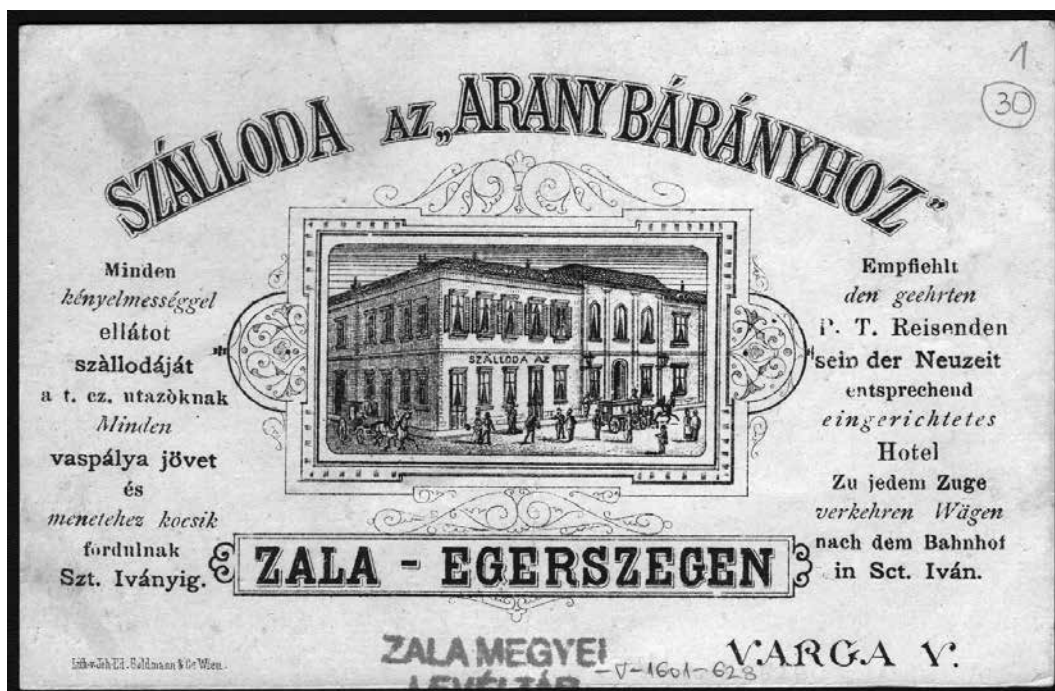
A reformkori épület egy szobaszámlán, 1860-as évek

zott: „A szorgalmasan és szépen kidolgozott, teljes számban meglevő rajzlapok ügyes kézre vallanak. Homlokzata egyszerű, szép, bár nem vendéglői jellegű; inkább bérházszerű. A saroktorony ormai száraz és merev kiképzésűek. A tér felőli homlokzat nem sikerült. Ugyanis egyenlő emelet magasságú két házat mutat. ... Alaprajza csak lényeges módosításokkal használható. Előcsarnok úgy a földszinten, mint az első emeleten hiányzik. Főlépcsője az áthajtótól távol esik.” Kifogásolták, hogy a tervező nem gondoskodott poggyászsobáról, a mellékhelyiségek elhelyezése sem volt megfelelő. Javasolták a főlépcső előtt elvonuló folyosó kiszélesítését, és hiányolták a színészek öltözőit is.