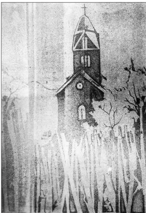
Varga Bernadett: Egregyi templom kárpitterv – 2014