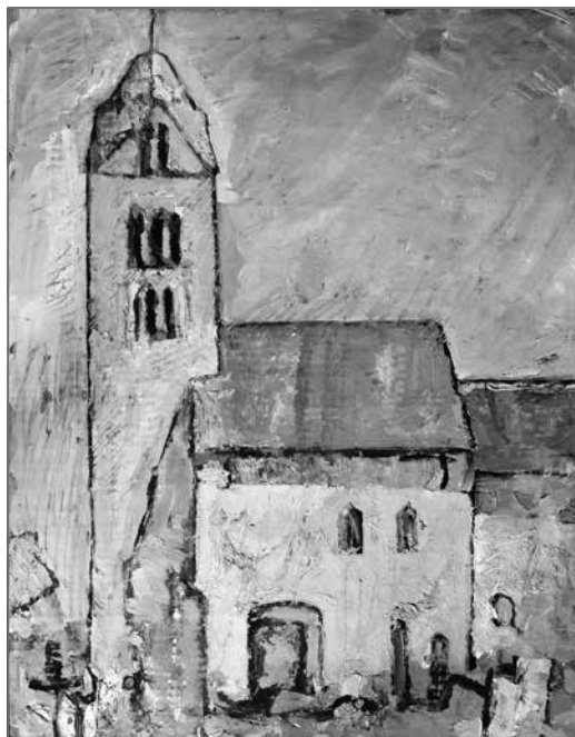
Tóth Csaba: Egregyi templom olaj, karton – 1986