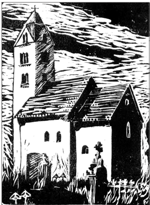
Varga Bernadett: Egregyi templom linómetszet, papír – 1986