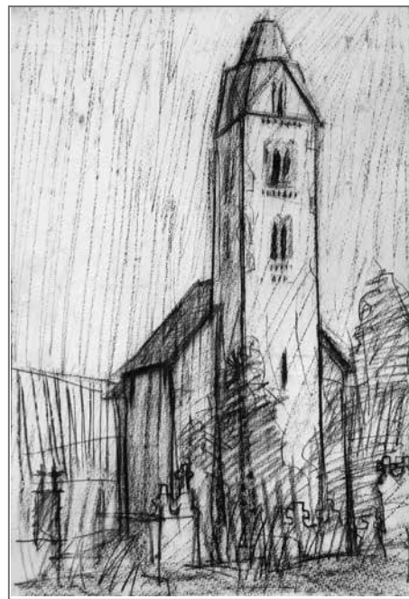
Tóth Csaba: Egregyi templom kréta, papír – 1986

ilyen teste az épület már-már gótikus arányait emelik ki. A rézsúsen függőleges vonal-raszter a templom ősi funkciójára utal, az ugyanis kapocs ég és föld között. (Hasonló szándékú grafikai megoldásokat Aba Novák Vilmos grafikáin, rajzain láthatunk.) A temető jellegzetes, mára sajnos nagyon megfogyatkozó ikerkeresztjeinek csak a sziluettjét látjuk itt- ott elszórtan a templom körül.