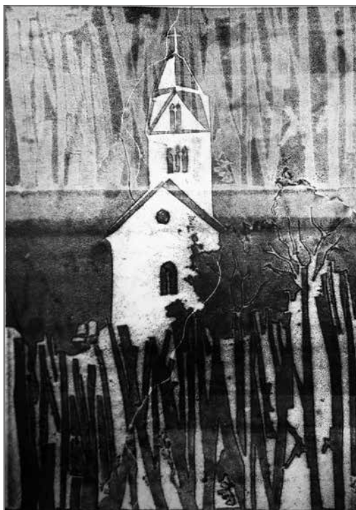
Varga Bernadett: Egregyi templom kárpitterv – 2014