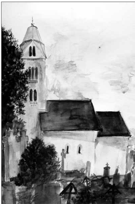
Tóth Magdolna: Egregyi templom akvarell, papír – 2013