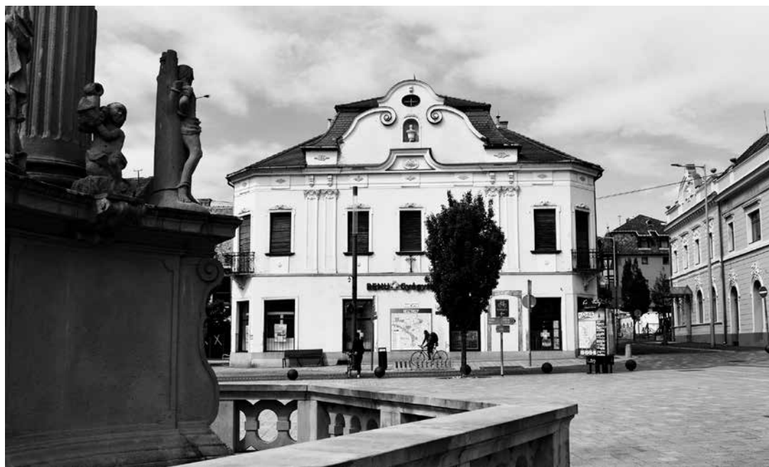
Az Órangyal Gyógyszertár épületének mai képe