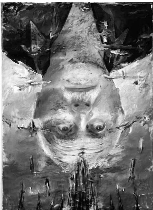
Nemes László: Önarckép

A portrék között megjelennek például a Mona Lisa festményt a neodadaista gesztusokkal „átszerkesztő”, dehonesztáló típusú kombinált képek, majd az egészen más érzelmi oldalról kisajátított, újra szakralizált, szintén a beragasztásos technikai megoldásokkal élő, színezett anyagpaszta-felületeket illetve jeltermészetű plasztikus gesztuselemeket alkalmazó