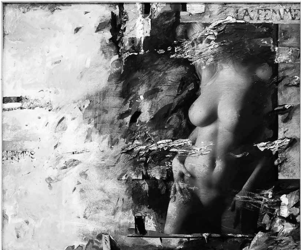
Nemes László: Zalai Madonna

Úgy mint: az állatszereplőket is alkalmazó korai mezítelen mellképek; a környezetükből tudatosan kivágott, kiemelt (rendszerint felül- vagy szembenézeti) hús-vér torzók; a későbbi külső vagy belső tájjá alakuló, kulminációs topográfiai testpontokba sűrűsödő, illetve szimbolikus vagy ikonikus formákká nemesedő, szakrális totemekké váló testdomborulatok, testhajlatok és testnyílások, a biomorf jelrendszerré absztrahálódott expresszív szerelemi jelenetek és virágcsendélet jelbeszéddek, vagy mondjuk így: festészeti virágénekek (lásd a Menyasszonyi csokor -, Friss virágok - és „ Húsevő virágok ”-ciklusát); a geometrikus foglalatokba fotólenyomatként dermedt, vagy a kézmozdulatfoltok gesztusaiból előhívódott, az emlékeztet majdnem egynemű festékmassza falába helyezett, gyönyörűsége szendergésükben kielégülten elnyúló, női fejek és testrészek.